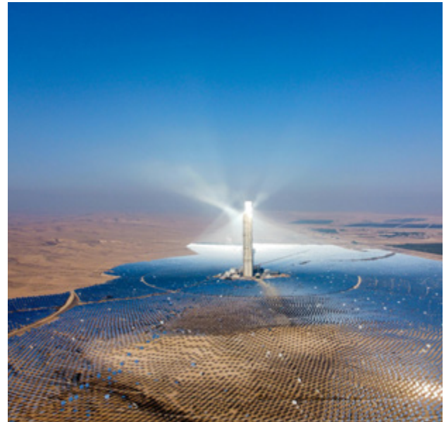
מגדל השמש של חברת BrightSource באשלים

והציבור לאורך שנים רבות מנעו את נקיטת הפעולות ההכרחיות לבלימת שינוי האקלים (הפחתת פליטות, פיתוח נרחב של אנרגיות חלופיות ממקורות מתחדשים, היערכות למציאות המשתנה ועוד) והובילו את האנושות להתמודדות עם אתגר חסר תקדים כשהיא על סף נקודת האל-חזור. עוד על הגורמים השונים להכחשת אקלים ראו במאמרם של פז וטל בעמ' 53–59 בגיליון זה.