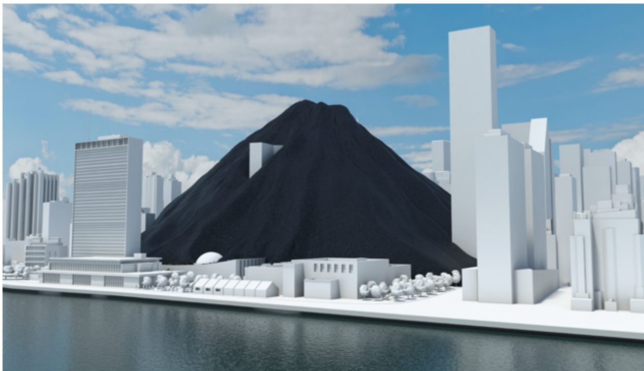
המחשה של כמות הפחם הנשרף בעולם בכל יממה – 22 מיליון טונות