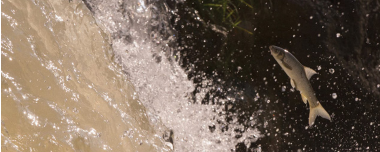
חפף ישראלי [ Capoeta damascina ] קופץ במעלה הזרם בירדן ההררי. נדידה לצורך רבייה של קרפיוניים גדולים, כדוגמת חפף ישראלי ובינית ארוכת ראש [ Luciobarbus longiceps ], מהכינרת במעלה הנחלים וחזרה אל האגם ממחישה את הקשר הביולוגי-אקולוגי בין האגם לאגן