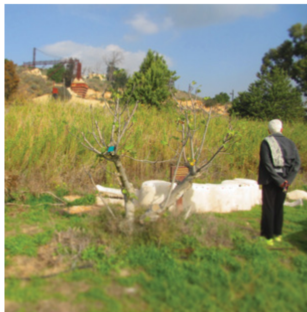
אחת ממשותפות המחקר, מוותיקות בנימינה, מבקרת באתר 'ספסל התנין', אחד מהאתרים האהודים במרחב