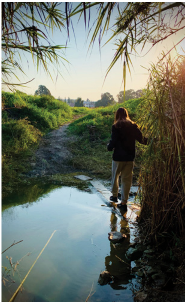
מעורבות התושבים בתהליכי שיקום ופיתוח של הנחל וסביבותיו, ושימוש בידע המקומי לניתוח המצב הקיים, תורמים לניהול מיטבי של האגן

באזור הנחל ובשכונות הקרובות לו. העונים לשאלון התבקשו לסמן על גבי מפה מקוונת אתר או אתרים בעלי משמעות עבורם (שאלון פתוח). לאחר בחירת האתר התבקשו הנשאלים לציין באיזו מידה (1 – כלל לא, 5 – במידה רבה מאוד) יש לאתר זה ערך עבורם, בהתייחס לשמונה סוגי תועלת אפשריים, שהם חלק מהערכים התרבותיים והחברתיים של שירותי המערכת האקולוגית – פנאי ונופש, הנאה אסתטית, פעילות חברתית, מורשת ותרבות, חינוך ומחקר, צומח ובעלי חיים, חקלאות ושייכות למקום [5] .