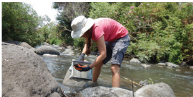
ניטור ביולוגי של נחל משושים

זיהום זה הוא הגורם העיקרי למצבו האקולוגי הירוד לאורך קילומטרים רבים של זרימה [9] . מצב אקולוגי ירוד מאפיין גם את יובליו הצפוניים של הקישון, בהם נחל עדשים ונחל מזרע (איור 1). לעומת זאת, מרבית הנחלים באגן הכינרת וכמחצית מהנחלים שנדגמו באגן הירדן הדרומי נמצאו במצב אקולוגי 'טוב' ו'מצוין'. בנחלים האלה עדיין קיימת שפיעה של מי מעיינות ממקורות טבעיים, ולהוציא תקלות אקראיות במערכת הולכת הקולחים והשפעות מקומיות של החקלאות, לרוב אין בהם הזרמה קבועה של מזהמים. עם זאת, ראוי לציין כי בשני האגנים בולטת השפעתן של הפרעות סביבתיות אחרות שאינן קשורות לזיהום, כמו איחוז מים לצורכי אדם (למשל נחל תבור תחתון, נחל נעמן), חקלאות (למשל נחל חרמון), רעיית בקר (למשל נחל תבור עליון) או פעילות מטיילים (למשל, נחל עמל ונחל הקיבוצים). למרות איכות המים הטובה באופן יחסי, המצב האקולוגי בנחלים שלטיל מוגדר כ'בינוני' בלבד, ויכול להצביע על תגובה שלילית של מאכלסי הנחל להשפעות סביבתיות נוספות, מעבר לאיכות המים. יתרה מזאת, הניטור הביולוגי מאפשר לזהות מקטעי נחלים שמצבם