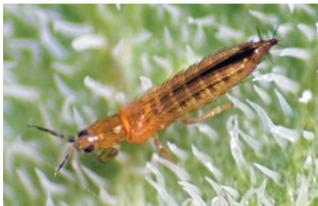
תריפס קליפורני ( Frankliniella occidentalis ), מזיק ונשא של וירוס כתמי הנבילה של העגבניה (TSWV), הפוגע בעיקר בגידולי עגבניה ופלפל בישראל ובעולם

בפרט, בוסס קשר חיובי חזק בין טמפרטורה וקצב ההתפתחות של חרקים [3] , והוערך שהתחממות של 2 מעלות צלזיוס עשויה לאפשר למזיקים שונים להשלים עד חמישה מחזורי רבייה נוספים בעונה [5] , ובכך להגביר באופן מעריכי את פוטנציאל הרבייה המרבי שלהם. לפיכך, צפוי שהתחממות האקלים תגרום להתפרצויות של אוכלוסיות נשאי מחלות, שגלומה בהן סכנה לאספקת המזון, כמו גם לאוכלוסיות בר ולאדם. קשה יותר להעריך את פוטנציאל הבקרה הביולוגית של מחלות על-ידי אויבים טבעיים בתנאים כאלה. לשם ביצוע הערכה כזו פיתחנו מודלים מתמטיים המתארים מנגנונים כלליים העומדים בבסיס דינמיקות ההפצה של שתי קבוצות מרכזיות של מחלות צמחים: מחלות שנגרמות מפתוגנים מתמידים (persistent), ששוכנים בגוף הנשאים לאורך רוב שלבי חיי הנשא, ומחלות שנגרמות מפתוגנים בלתי מתמידים (non-persistent),