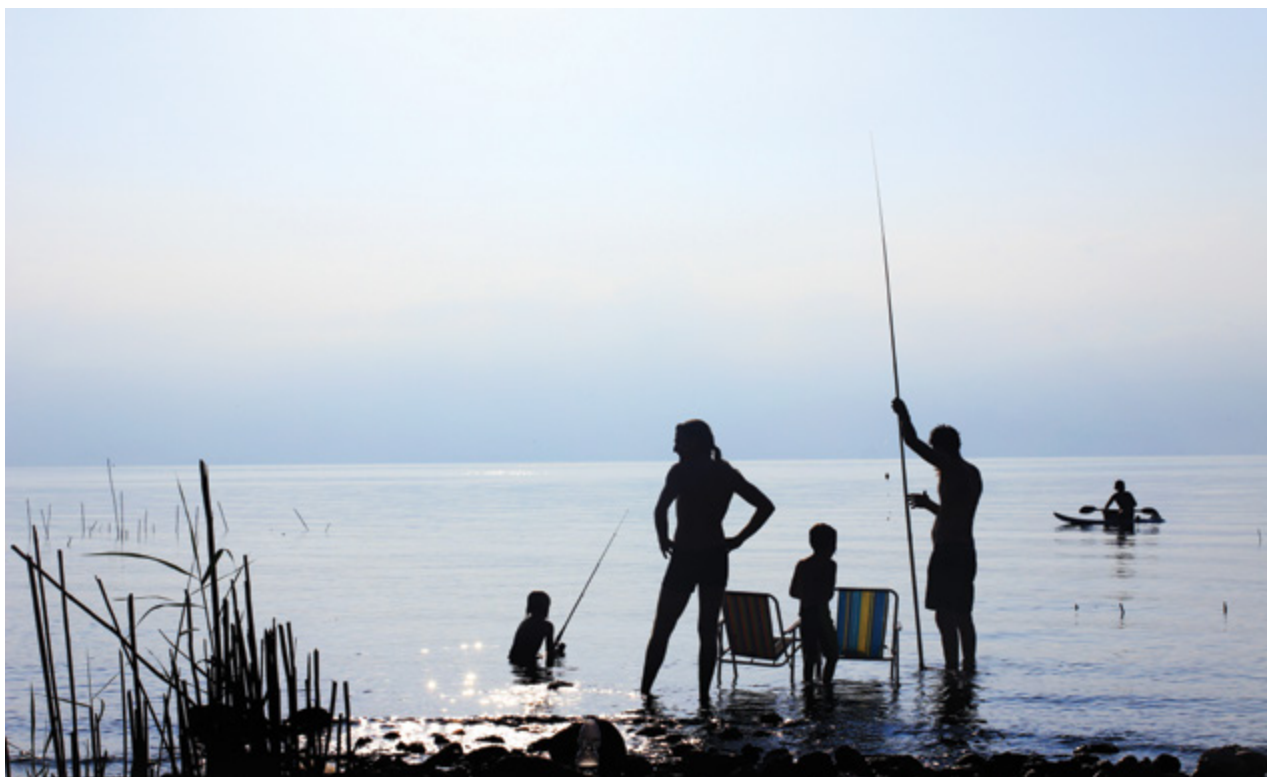
חוף בכינרת, מרץ 2017. "הבעיה המרכזית ביותר בישראל הנובעת משינוי האקלים היא הירידה במשקעים, בעיקר באגן הכינרת"