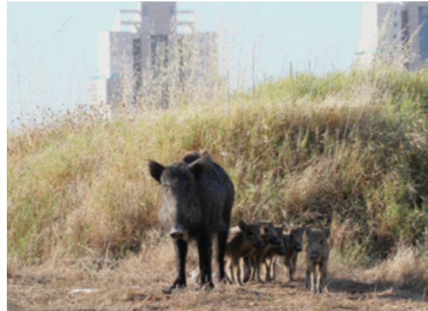
חזירי בר פולשים ליישובים. דרך הטיפול באוכלוסיות חיות בר מתפרצות היא תברואה

היא הירידה במשקעים, בעיקר באגן הכינרת. כיום כבר אין ספק שמדובר בשינוי ארוך טווח [3,8]. אם החקלאות תמשיך לנצל מים באגן הכינרת בכמות שהיא מנצלת כיום, נחלי האזור, האחרונים שהותרו עם ספיקת מים מרשימה, יתייבשו, ולכן יש צורך למצוא פתרון לחקלאות ולשחרר את מי המעיינות לטבע.