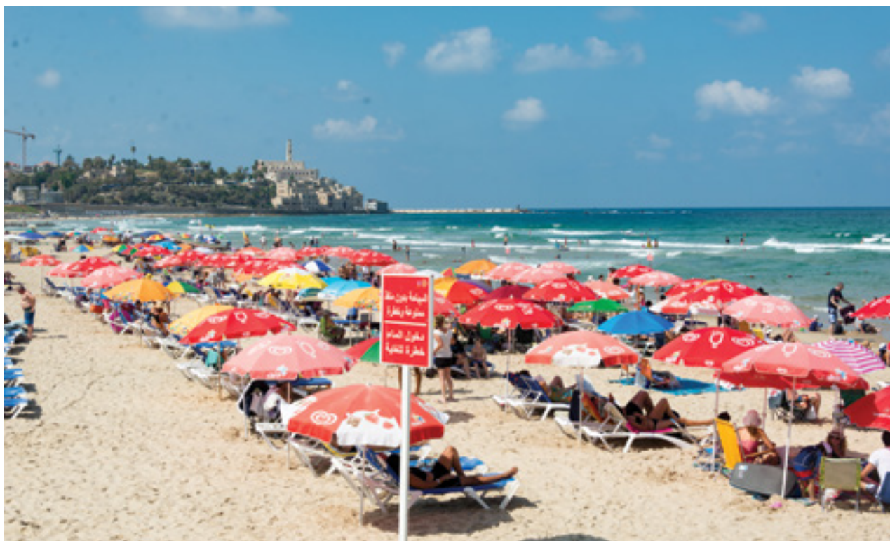
חוף הים (בצילום, בתל-אביב) כמפלט זמני מ"אי החום העירוני" השורר בסביבה העירונית הבנויה