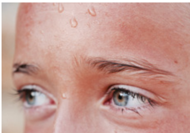
בטמפרטורות חמות חוסר נוחות תרמית מתבטא בהזעה.

מחקרים שונים בישראל הראו מגמה דומה של התחממות העיר. מחקר שניתח נתונים מתחנות מטאורולוגיות בכל רחבי ישראל מצא תנודות גדולות בטמפרטורות העונתיות בקיץ [9,10] . ניתוח התפלגויות טמפרטורות המקסימום היומיות בישראל מצביע על נטייה מובהקת להגברה בשכיחות ערכי הקיצון. במילים אחרות, ביום הקיץ חם יותר והחורף קר יותר [3] . מחקר נוסף הציג כי בעתיד צפויה בישראל ירידה משמעותית בכמות המשקעים [2] . מחקר נוסף שנעשה בבאר שבע מצא כי ההתחממות העירונית מגבירה