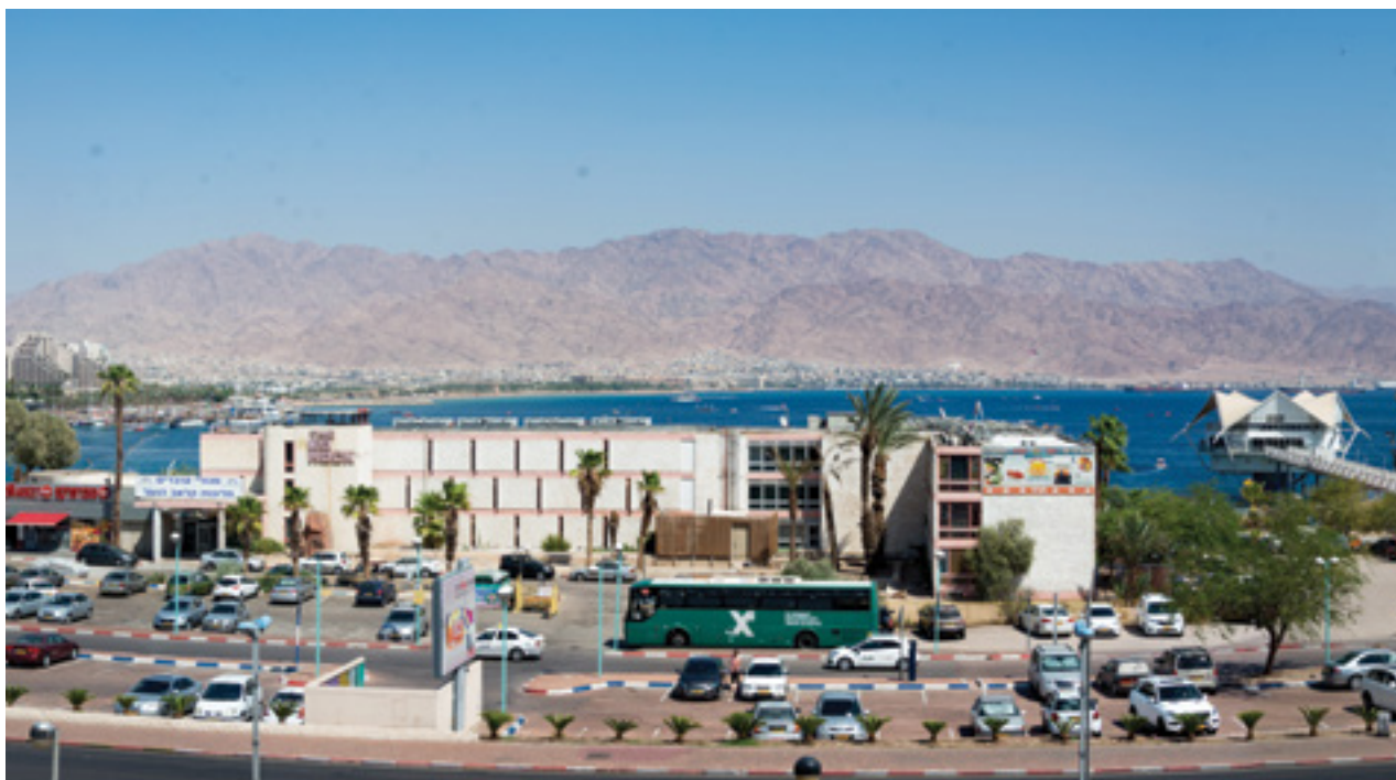
אם אוכלוסיית אילת תגדל בקצב מהיר, הטמפרטורה בשעות הצהריים החמות עלולה לעלות בכמעט 4 מעלות עד שנת 2060

התמקדות בארבעה אזורים עירוניים שונים בארץ. כדי להשוות את הגידול העירוני ולבחון את הממצאים שהתקבלו מהתחנה הכפרית, נאסף מידע על השינוי בכמות האוכלוסייה העירונית. הבנת המתרחש במהלך השנים מאפשרת ללמוד על השינוי הדמוגרפי בעיר, על שינוי האקלים בה ועל השפעתו על רמת החיים והאוכלוסייה בערים השונות ובאזורי האקלים השונים. החישוב של חיזוי האקלים במחקר נעשה על סמך כמות האוכלוסייה העירונית ולא על פי סוג האקלים או הטופוגרפיה והשפעתם על האקלים. לפיכך, ובהתבסס על סגנון בנייה זהה, סברנו כי שינוי טמפרטורה משמעותי יותר ייראה בשתי הערים הגדולות, תל-אביב וירושלים, בהשוואה לערים באר שבע ואילת. כלומר, במחקר זה נבדק גם הסיווג על פי אזורים המכונה Local Climate Zone (LCZ) [19]. סיווג זה נעשה על פי חלוקת המבנה העירוני, צפיפות, גובה המבנים והצמחייה העירונית. מאז שנות ה-50 של המאה הקודמת גדלו אוכלוסיית ישראל והשטח הבנוי שלה במהירות [1], ולכן העלייה בטמפרטורה העירונית צפויה. תוצאות המחקר תומכות בצפייה זו למגמות של התחממות עירונית בכל ארבע הערים. השינוי בולט יותר בערים המאופיינות באקלים יבש יותר. הנתונים מצביעים על השפעתה המקומית של העלייה בטמפרטורת האוויר ועל חשיבות התכנון של תהליכים עתידיים. בעוד מחקר זה יכול לשמש "הערכה ראשונית" של השינויים