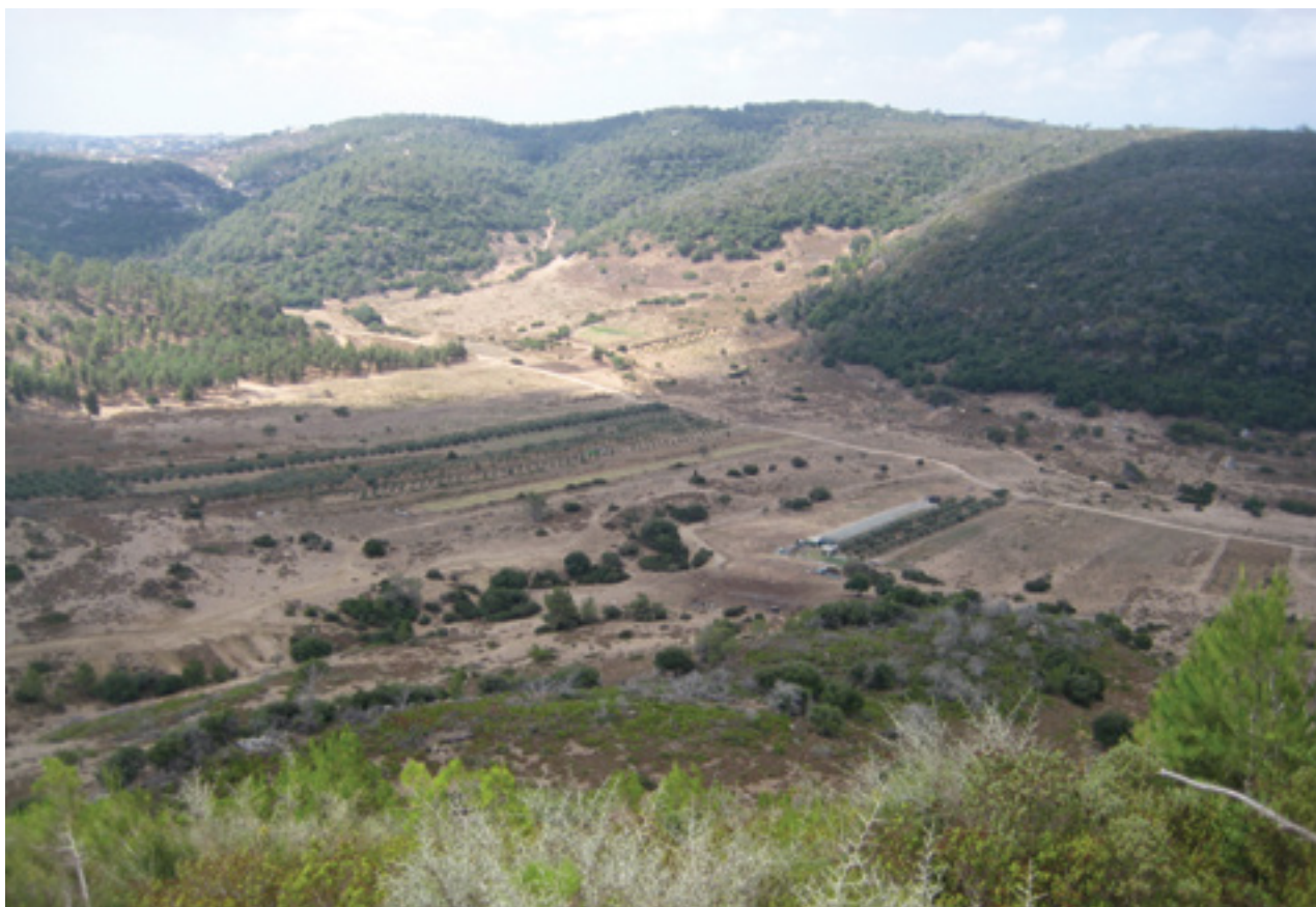
המרחב הביוספרי בכרמל: מי מנהל, ועבור מי? מה המטרות ובאיזה קנה מידה מרחבי?