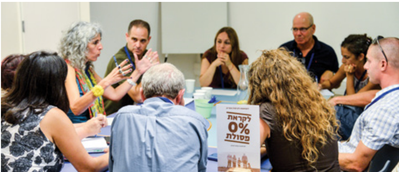
מפגש פורום בעלי עניין של השותפות לקיימות אזורית בבקעת הנדיב