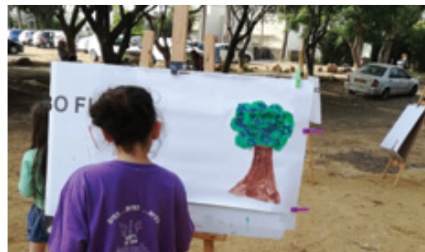
הפינג של מיזם קהילתי שימור חורשת לנגה ושדרת הסיגלונים בזכרון יעקב, מטעם השותפות לקיימות אזורית ורמת הנדיב

ההגדרה הטיפולוגית התייחסה למאפיינים עיקריים הקושרים מודלים שונים תחת קורת גג אחת, ולהלן תיאורם: