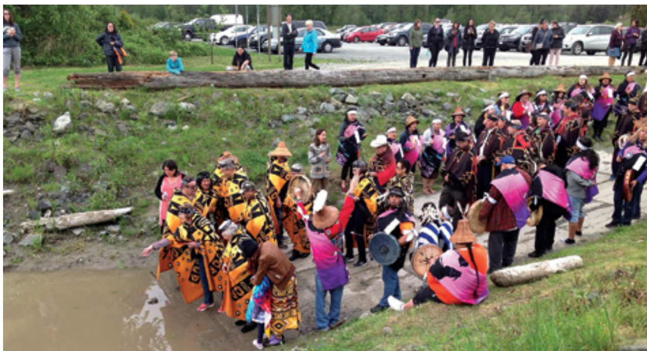
סקס השבת עצמות דגני סלמון לנהר שנידוגו ממנו בקולומביה הבריטית. דג הסלמון הוא סמל מרכזי ביוזמות למען קיימות מקנדה ועד יפן

הציר החמישי: אוריינטציה עירונית מול מרחבים עירוניים פתוחים ציר זה קשור באופן הדוק לציר החברתי-כלכלי. כפי שמיזמים המתמקדים באזורים עירוניים נוטים להתמקד במערכות אנושיות, כך מיזמים המתמקדים בשטחים פתוחים נוטים להדגיש באופן בולט יותר את הנושאים האקולוגיים.