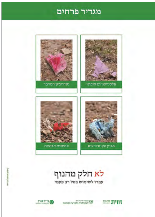
הזוכה במקום השלישי במכללת האקדמית עמק יזרעאל: דינאל צדיה