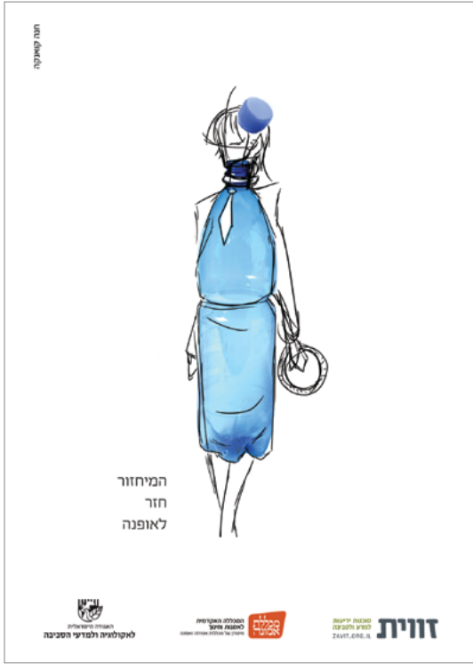
הזוכה במקום השלישי במכללת אמונה: תנה קטנה