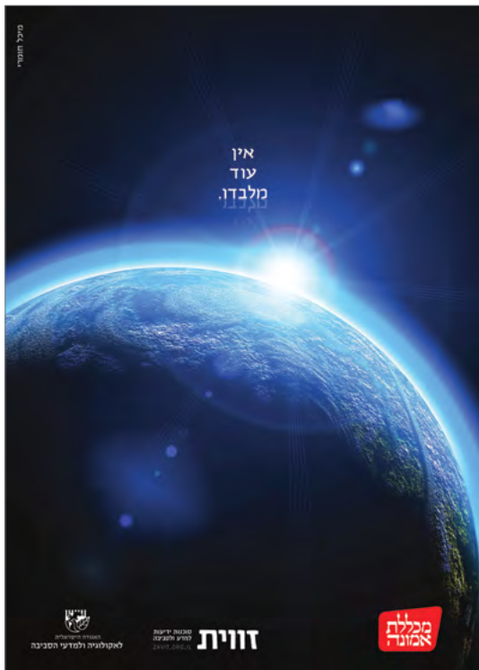
הזוכה במקום הראשון במכללת אמונה: מיכל חומרי