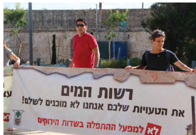
המאבק של תושבי מ.א. מטה אשר והרשות המקומית, המתנגדים להקמת מתקן התפלה (ומציעים את מפרץ עכו כמיקום חלופי), הוא דוגמה עכשווית לתופעת הנמב"י

מבחן מיהו "הציבור" – הגדרה זו משתנה בכל מקרה ותלויה באינטרסים, שהרי ציבור א' המתנגד להקמת תשתיות לטיפול בגז טבעי בסמיכות ליישובו, עלול לגרום בכך לפגיעה בציבור ב', שעשוי להיפגע כלכלית (למשל, מהיעדר יכולת להתחבר לרשת הגז) או בריאותית (למשל בשל המשך הפעלת תחנות כוח פחמיות). לפיכך, יש לבחון אם ההתנגדות של ציבור מסוים למיקום סמוך אליו עלולה לפגוע בציבור אחר. אם כן, הרי שהדבר מצמצם את מידת הלגיטימיות או המקובלות של התנגדות הנמב"י, משום שבמצב זה המתנגדים רואים רק את טובתם שלהם ופחות את זו של ציבור אחר. למשל, ניתן לומר כי התנגדותם המתמשכת של תושבי הגליל המערבי להקמת מתקן התפלה המתוכנן לקום סמוך לאזור מגוריהם, עלולה לפגוע באוכלוסייה גדולה יותר ובערכי טבע באזור שייפגעו ממחסור מקומי עתידי במים לחקלאות, לצריכה ביתית ולשיקום נחלי האזור.