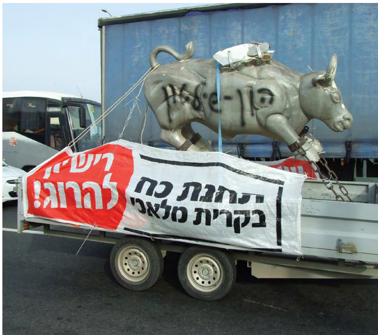
הפגנה במסגרת מאבק תושבי קריית מלאכי ובאר טוביה כנגד הקמת תחנת כוח באזור התעשייה באר טוביה

בני פירסט* ומישל פורטמן הפקולטה לארכיטקטורה ובינוי ערים, הטכניון - מכון טכנולוגי לישראל benny.furst@mail.huji.ac.il *