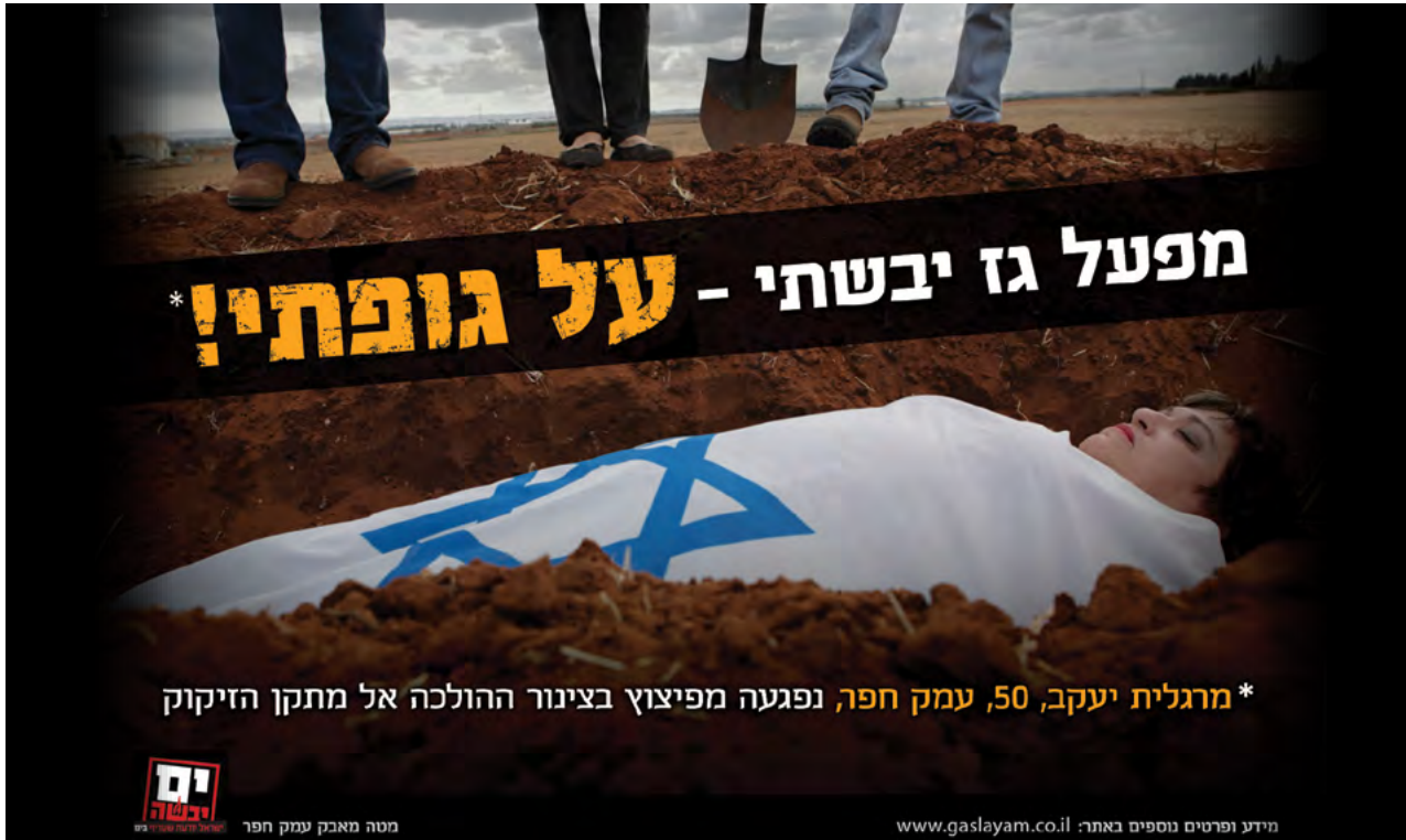
"מאבקם של המתנגדים תושבי חוף הכרמל ועמק חפר אופיין בדרישה חד־משמעית - ילא אצלנו, תוך שימוש ברטוריקה הרומזת לאסון"