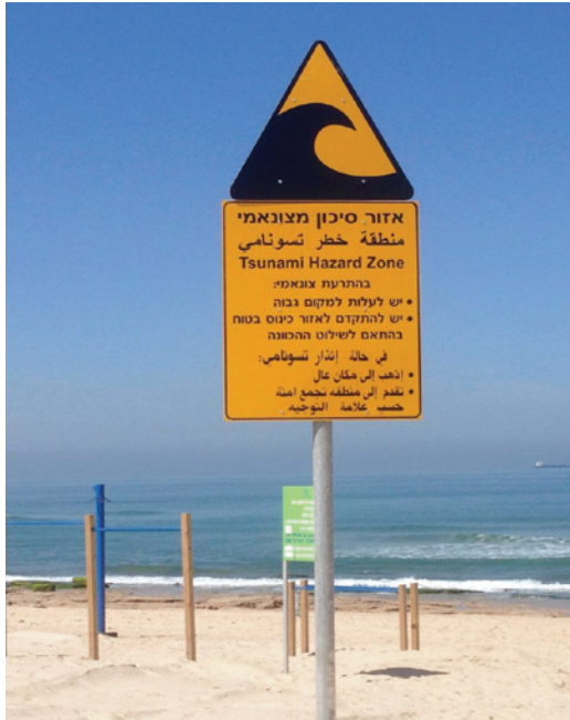
שלט המתריע על אזור סיכון מצונאמי בחוף אשדוד

יידרש לתפקד באופן עצמאי ולהתריע על צונאמי שעלול לסכן את חופי מדינת ישראל, ולעשות זאת ללא תלות במרכזי התרעה בין-לאומיים. עם זאת, "נחשול נצפה" יתאים ויסנכרן את עצמו לדרישות הסף, לשיטות העבודה, לנהלים ולתקנים, כמו גם לשפה המשותפת, הנהוגים במערכות ההתרעה הבין-לאומיות בעולם, לרבות אלה של מדינות הים התיכון השכנות לישראל. במקרה הצורך יעביר המרכז את המלצתו לצוות ההתרעה הלאומי "מגדלור".