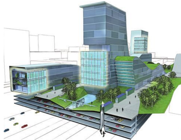
Highway Habitat - פרויקט גישור מעל איילון המציע חיבור בין שני חלקי המטרופולין, שנחצים על-ידי רצועת התשתיות: ניצול מיטבי של הקרקע, פארק עירוני לינאר, פרוגרמת עירוב שימושים ומערכות לטיהור אוויר באמצעות צמחייה | תכנון: קנפו כלימור אדריכלים

הצורך במיציא פוטנציאל השכבות העירוניות הנסתרות הוא הזדמנות לגיבוש דרך פעולה לגילוי אזורים אלה ולשילובם בעיר על-ידי עיבוי מרחבי מעל תשתיות, בתווך בין בניינים, כחלק ממעטפת מבנים ובמרחב התת-קרקעי. עיבוי במרחב הפרטי (כפי שכבר מיושם באמצעות תמ"א 38 או פינוי-בינוי), תוך חיוב שילוב דיור ציבורי, מאפשר איזון ומגוון דמוגרפי ללא השקעה ציבורית. עיבוי המרחב הציבורי הוא בסיס לתוספת ייעודים ציבוריים ושטחים פתוחים לרווחת התושבים. בנייה על שטחים אלה לצורכי ציבור, המשלבת קידום דיור ציבורי או בנייה מסחרית, תיצור בסיס רווח לרשות המקומית. מדרגה נוספת במינוף שטחים לשדרוג העירוני היא הפיכת המרחבים הללו לפרודוקטיביים כשטחים פתוחים ירוקים לשירותי המערכת האקולוגית ולחקלאות עירונית. המרחב התת-קרקעי מזמן אפשרות לאכלוס פונקציות שאינן זקוקות לאור טבעי. פונקציות שכוחות שכבר נמצאות בשימוש תת-קרקעי הן חניה ואחסנה. במקומות רבים במרכזי ערים בעולם קיימים מרכזים מסחריים תת-קרקעיים. פונקציות של פנאי ותרבות, כדוגמת אולמות תאטרון, קולנוע וספורט, יכולות להיבנות במרחב התת-קרקעי ולתרום את חלקן למרחבים ציבוריים פתוחים מעליהן. ניצול אינטנסיבי של מרחב זה יתרום לשחרור שטחי קרקע יקרים למבנים נוספים מבוססי אור טבעי. לבנייה התת-קרקעית יתרונות בתחום האנרגיה בזכות 'אפקט המערה', המנצל את הבידוד התרמי הטבעי של האדמה. כתוצאה מכך, ניתן להפחית את עלויות מערכת מיזוג האוויר ולהפחית