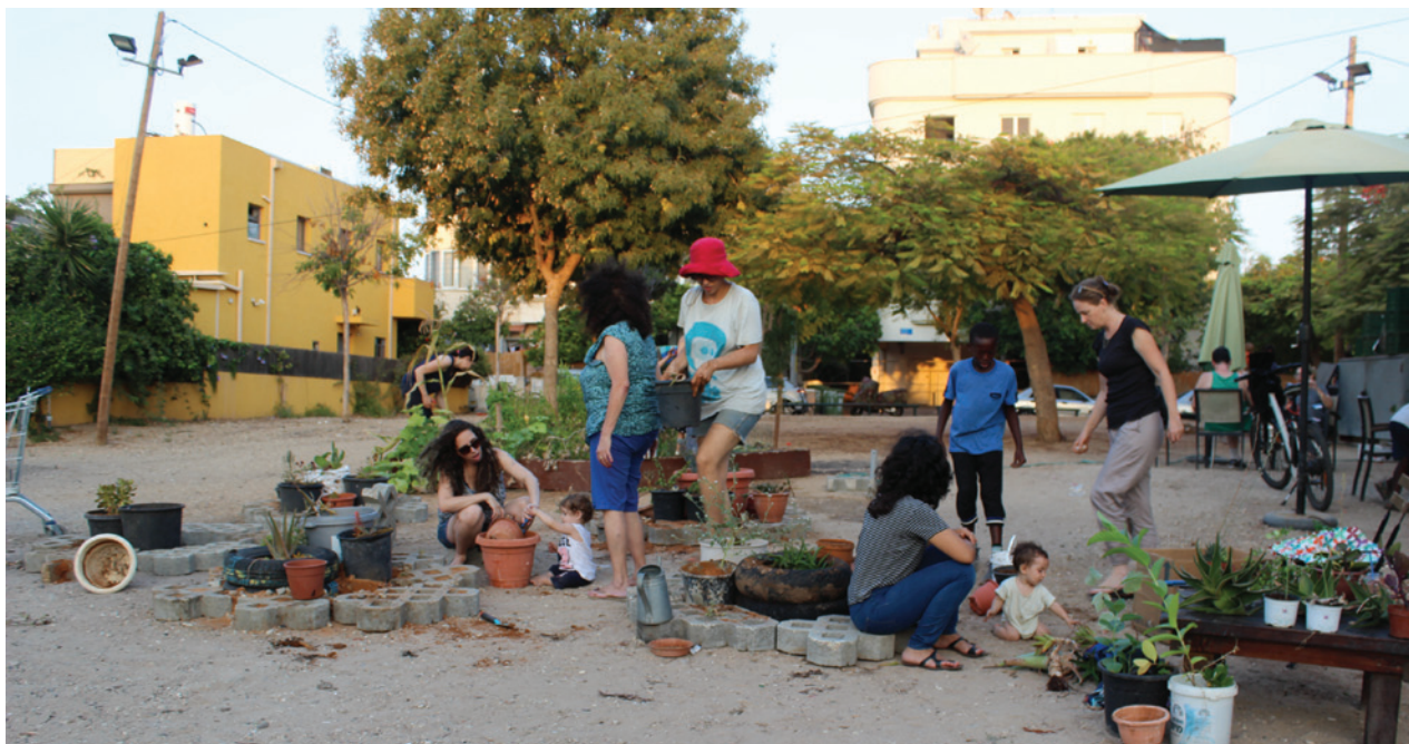
גינת תבלינים שהוקמה ביוזמת 'קפה שפירא' בשטח הסמוך לבית הקפה, משמשת נקודת מפגש קהילתית. לידה קמה גינת סוקולנטים ביוזמת פרום החקלאות השכונתית, הפועל לטיפוח חקלאות וגינון בשכונה. שכונת שפירא, תל-אביב