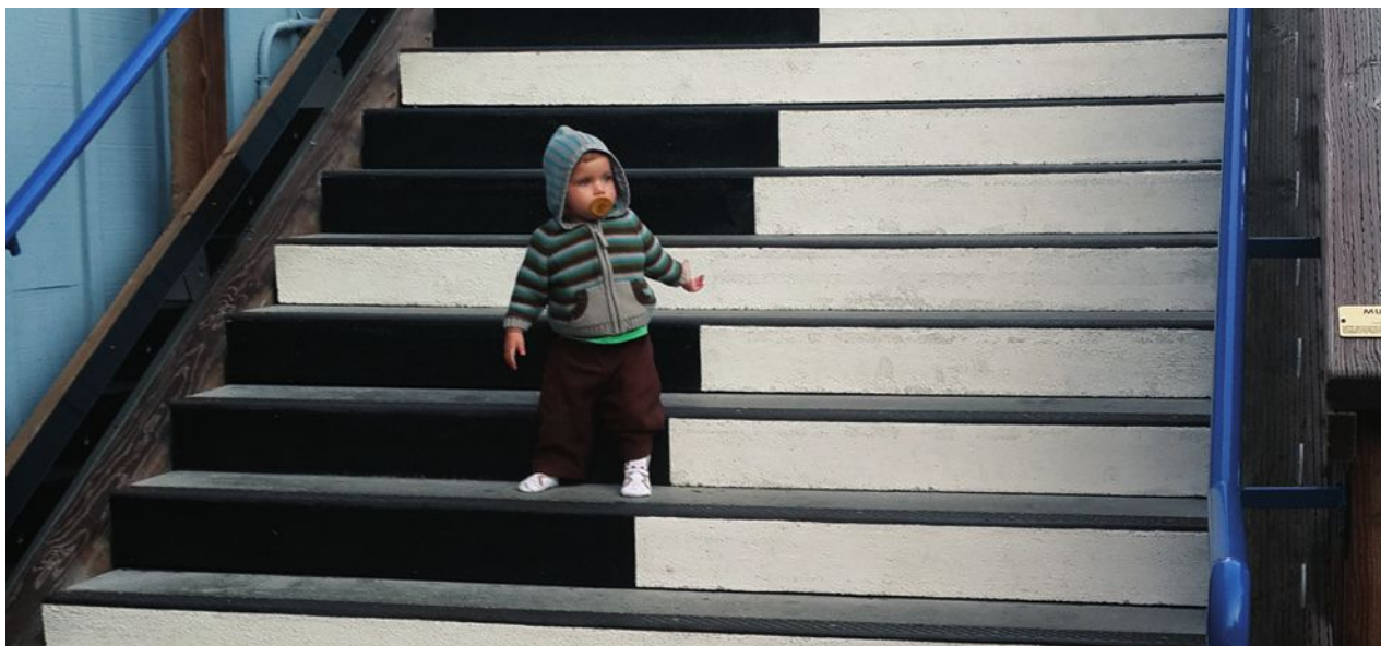
דוגמה לכוחה של ארכיטקטורת הבחירה להשפיע על התנהגותנו ולהביא לקבלת החלטות בריאות ומקיימות יותר - עיצוב המרחב בצורה מושכת יגרום לאנשים רבים להעדיף עלייה במדרגות על פני עלייה במעלית