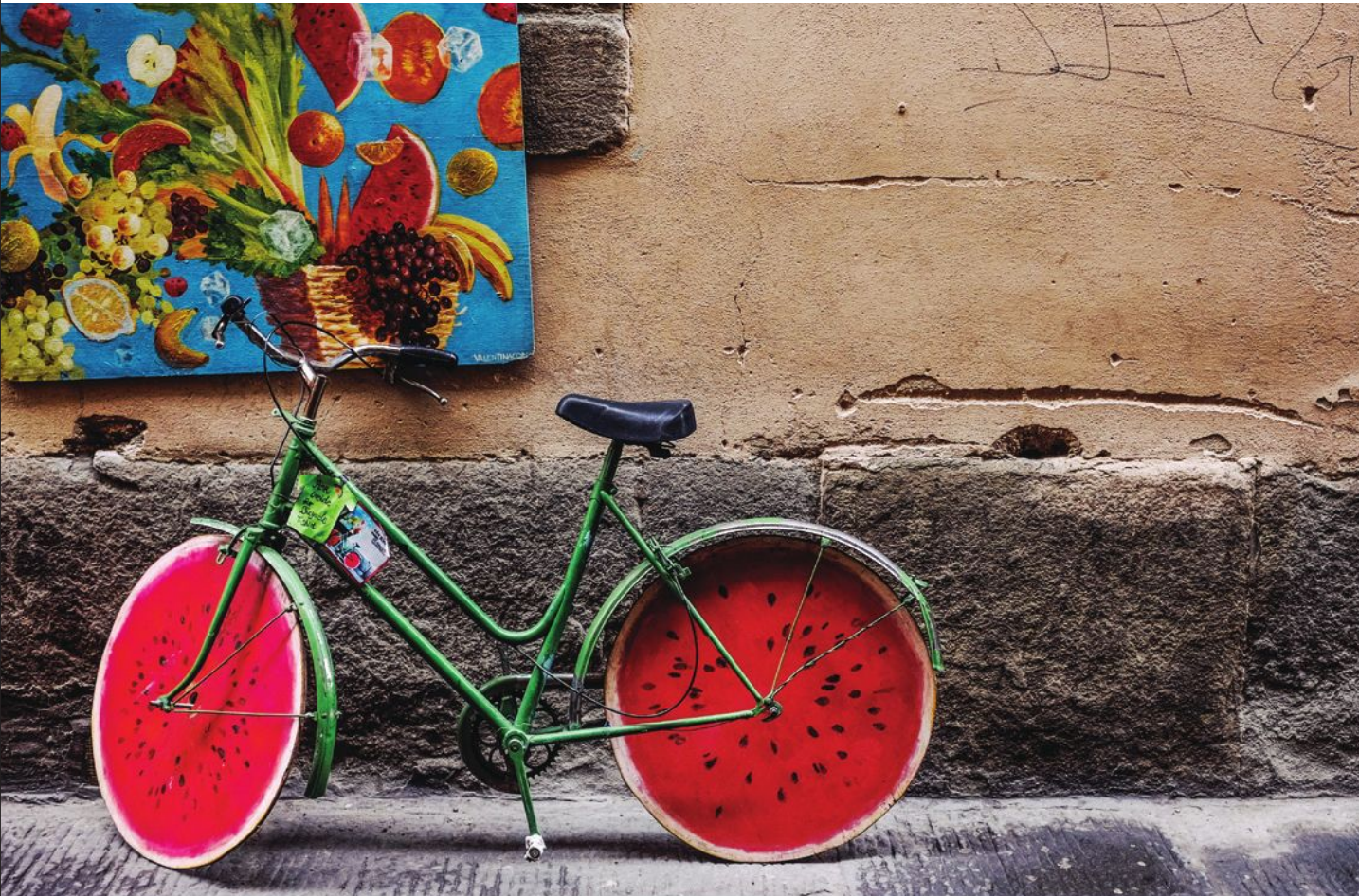
שימוש באמצעי תחבורה מקיימים, מזון מקומי ובריא, צריכה מושכלת ומקיימת של מוצרים - כולם מרכיבים של אורח חיים עירוני מקיים