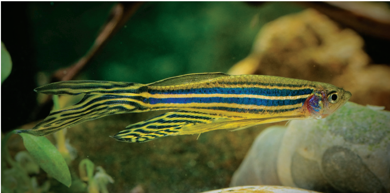
עוברי דג זברה ( Danio rerio ) שנחשפו לחלקים שהודפסו במדפסות תלת-ממד באמצעות טכנולוגיית סטראוליתוגרפיה, סבלו כולם ממומים, ומתו תוך שבוע

לצורך הניסוי הודפסו דסקות בקוטר 40 מ"מ ובעובי 4 מ"מ מחומרים סטנדרטיים למדפסות תלת-ממד. במדפסת FDM הודפסו דסקות מאקרילוניטריל בוטאדיאן סטירן (ABS), חומר נפוץ בתעשיית הפלסטיקה. במדפסות ה-STL הודפסו דסקות משרפים אקריליים נוזליים, המתמצקים בחשיפה לאור. לאחר ההדפסה נוקו הדסקות בהתאם להוראות היצרן. נוסף על כך, השתמשו החוקרים בדסקות ה-STL, שעברו טיפול נוסף באמצעות חשיפה לאור על-סגול. עוברי דגי הזברה חולקו לארבע קבוצות שנבדלו ביניהן בסוג החשיפה: FDM, STL, STL שנוקה בחשיפה לאור על-סגול וקבוצת ביקורת. 90 עוברים נחשפו לכל סוג דסקה בצלחות פטרי סטריליות עם מים על-טהורים (ultrapure water). התוצאות מעוררות דאגה. שיעור הישרדות העוברים מקבוצת ה-FDM היה קרוב לזה של קבוצת הביקורת, אבל בקבוצת ה-STL