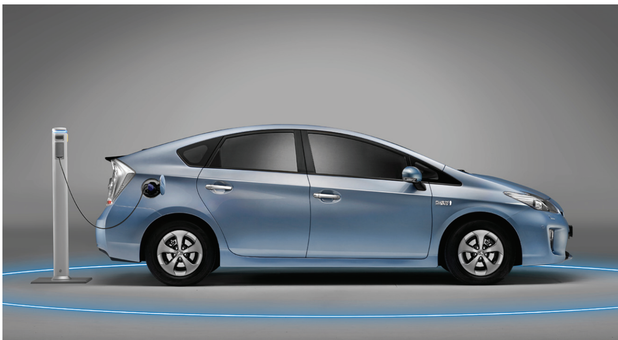
מבין סוגי הרכב שנבדקו במחקר, העלות לק"מ ברכב היברידי נטען (Plug-in Hybrid) היא הגבוהה ביותר

היא טרם הבשילה לכדי שימוש בקנה מידה רחב, ועומדים בפניה אתגרים בנושאי עלות, זמן טעינה ומגבלות טווח נסיעה - שאף הולידו את המושג "חרדת טווח".