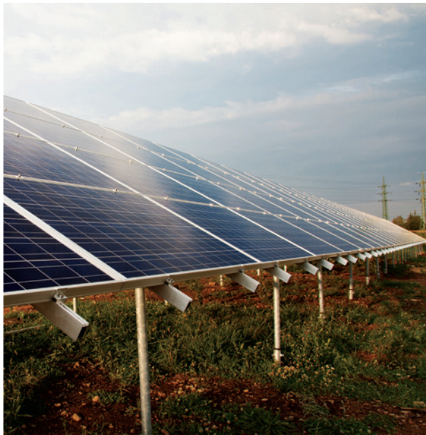
האם נזקן הסביבתי של התחנות הסולריות עולה על התועלת הסביבתית הגלומה בהן?

- צפוי נזק משמעותי ביותר. נתונים מדאיגים מגיעים ממדינות שהוקמו בהן טורבינות על צירי נדידה של עופות, כמו ספרד, ויש ספרות מדעית ענפה בנושא זה.