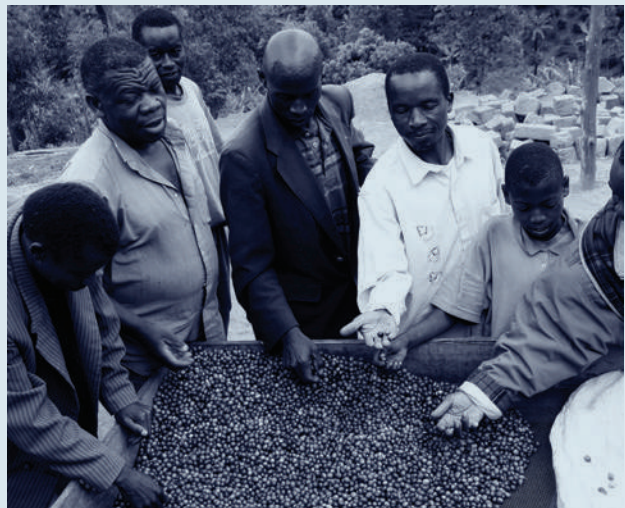
Root Capital - קרן השקעות חברתיות הפורצת דרך למימון עסקים חקלאיים קטנים באזורים כפריים באפריקה ובאמריקה הלטינית

משבר שינוי האקלים וניצול היתר של דלקי מחצבים הגורם לו, הם דוגמה קלאסית לניצול יתר של משאב ציבורי ולמימוש תרחיש 'הטרגדיה של נחלת הכלל'. לאור העובדה שניסיונות ליצור התערבות מאסֶדְרֶת בין-לאומית או שוק פחמן עולמי להגבלת פליטות גזי החממה לא הניבו פירות משמעותיים עד כה, נשאלת השאלה האם החלופה שאוסטרם זיהתה במחקריה מציעה פתרון כלשהו למשבר שינוי האקלים?