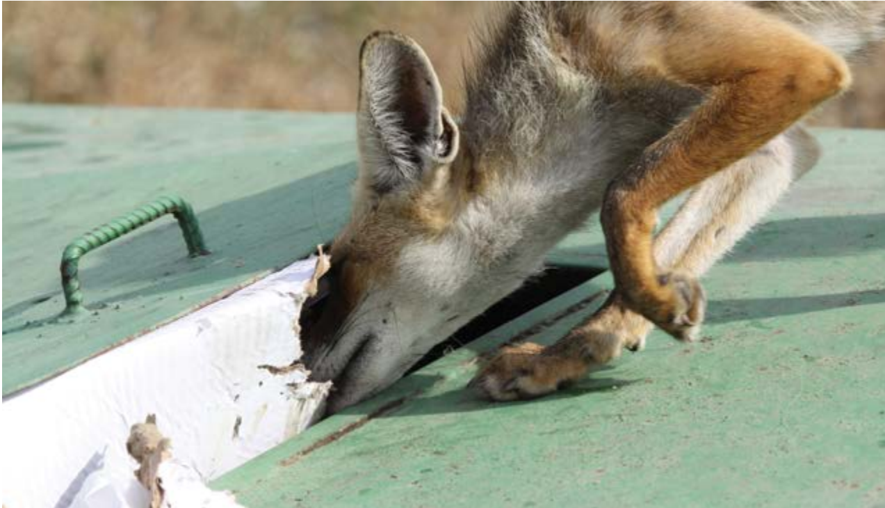
תן זהוב על מכולת אשפה פתוחה. לאחר החלפת המכולות ופחי אשפה לפחים מוטמנים קטנה פי ארבעה כמות התצפיות של תנים בחניוני מטיילים

כנונה, ואין בכך השפעה משמעותית על חיות הבר? אוכלוסיותיהם של מינים שונים של בעלי חיים מוצאות חלק לא מבוטל ממזונן בשאריות אשפה של מטיילים ובפסולת אורגנית מסוגים שונים מפעילות האדם, הזמינות להם באזורים רבים בישראל. דוגמאות לכך מוכרות באזורים הסמוכים ליישובים חקלאיים (בגליל, בגולן, בכרמל ובהרי יהודה), באתרי פנאי ונופש (כדוגמת חניונים למטיילים, יערות קק"ל ופארקים שונים), וכן בתחומי יישובים עירוניים שונים. עבודות קודמות הראו שעודפי מזון זמין גורמים לגידול יתר של אוכלוסיות שועלים ותנים, שצמצום מקורות המזון מאפשר את ויסות אוכלוסיותיהם [1,2,5] , וכן שאוכלוסיות יתר של תנים המתקיימות לצד יישובים עם פסולת חקלאית, מאיימות על קיומן של אוכלוסיות צבאים בגולן [3] .