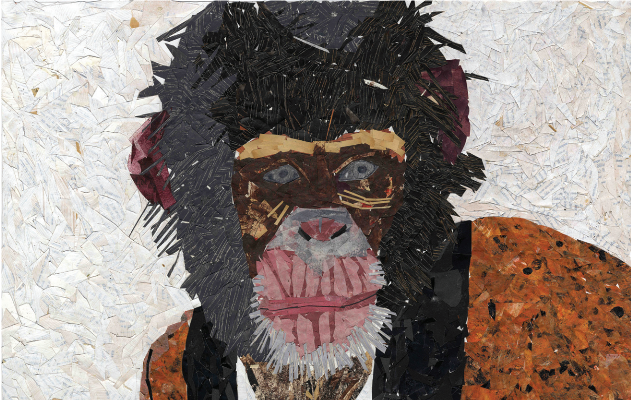
המצב התודעתי האנושי הראשוני היה של אחריות על הטבע, אך תודעה זו פחתה ככל שההיסטוריה התקדמה | ידידיה קוסמן, הקופים, קולאז' ורישום ©

ההשתוללות הזאת. כשחוקרים את הנושא הזה מגיעים לסוגיות של אושר, שביעות רצון, ומה אנשים רוצים מהחיים שלהם. כל עוד לא פותרים את הבעיות היסודיות של בני האדם, קשה מאוד לטפל בבעיות של הסביבה.