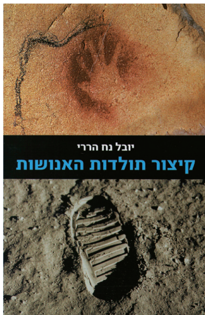
מספרי העיון המצליחים בישראל בשנים האחרונות

במהפכה המדעית-תעשייתית האדם נפטר גם מהאלים. האדם מבין את הטבע ואת חוקיו באמצעות שכלו. מכיוון שלא קיבלתי שום דבר מאף אחד, אינני חייב שום דבר לאף אחד, ואני