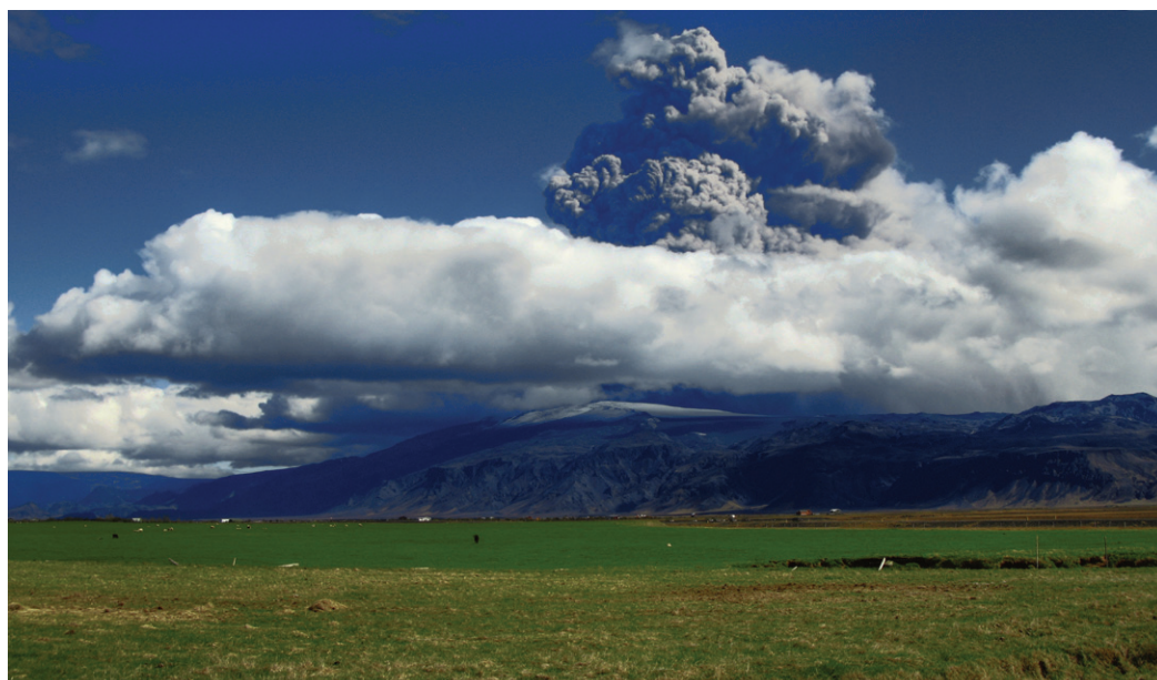
פעילות טקטונית משפיעה גם היא על הרכב האטמוספירה. התפרצות הר הגעש Eyjafjallajokull, באיסלנד, אפריל 2010

[2] מכון רקח לפיזיקה, האוניברסיטה העברית בירושלים shaviv@phys.huji.ac.il