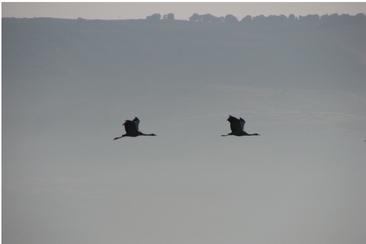
במחקר התגלה לראשונה כי חלק מהעגורים העוברים דרך עמק החולה מגיעים ממערב סיביר

לשם קביעת אזורי הקינון של העגורים שחולפים וחורפים בישראל, מדדנו את ערכי ה- \delta^{18}O בנוצות תעופה שנאספו מ-103 פרטים (שנמצאו מתים) במהלך מחקר בשתי עונות בעמק החולה. כמו כן, נמדדו ערכי ה- \delta^{18}O ב-15 דגימות שנאספו באזורי הקינון באירופה וברוסיה לשם יצירת משוואת כיוול, ספציפית למין, בין הערכים האיזוטופיים בסביבה לבין הערכים בנוצות. כדי להעלות את דיוק השיוך של הפרטים לאזורי הקינון שלהם בקיץ ולצמצמו