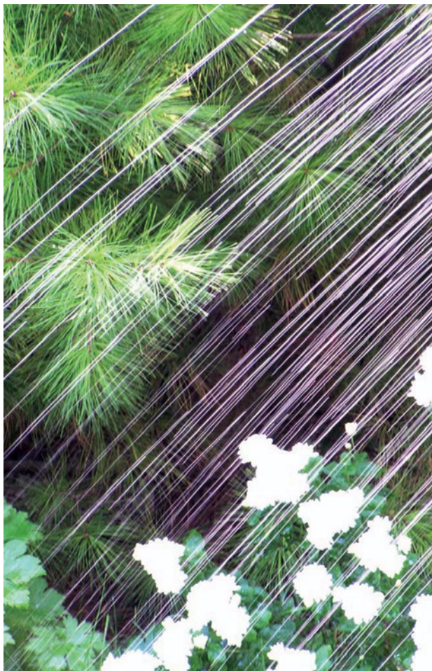
השקיה יוצרת מיקרו־מקלים נוח לנמלת האש הקטנה