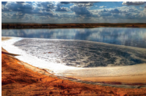
רמת חובב באדיבות המועצה המקומית רמת חובב ליהודים ריח | צילום: חיים אוהיון, מקור משמעותי - בכרות השקעה -