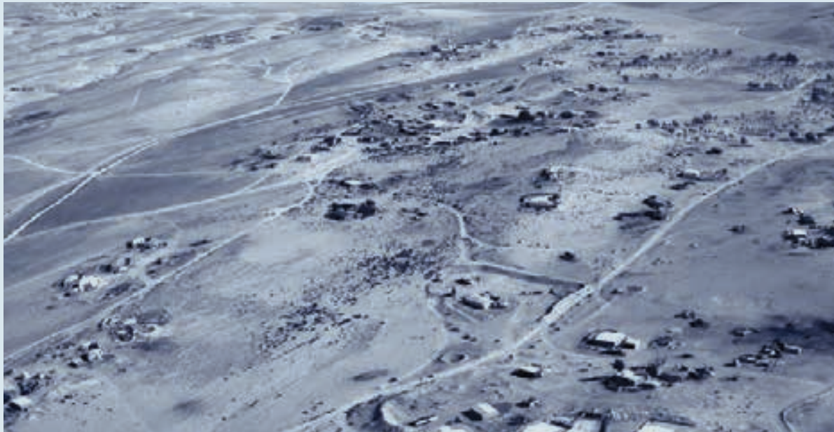
התיישבות מפורדת, שטחי חקלאות קטנים וכביש גישה לכל שטח

מהותית ביכולתם של המינים המדבריים לנוע בעתיד לבתי גידול קיצוניים פחות.