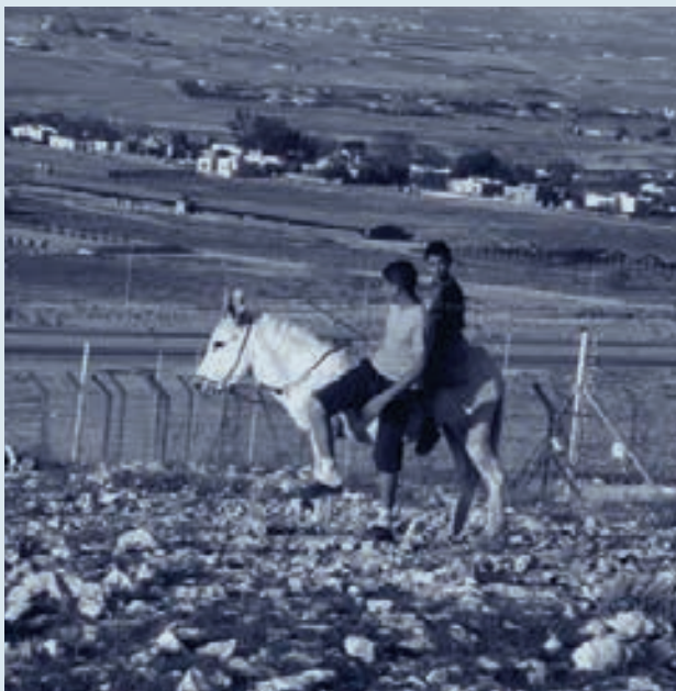
לבדואים התנהלות תרבותית ייחודית המוסיפה על התרבות היהודית העירונית-תעשייתית הדומיננטית

התרומה הפוטנציאלית והתרומה בפועל של תרבות רעיית הצאן הבדואית למגוון הביולוגי, ולכן לשימור אקולוגי, ראויה להכרה במסגרת המדיניות הסביבתית בישראל תוך אסדרתה בהתאם לעקרונות אקולוגיים מושכלים. לכך יש השלכות ישירות למדיניות ההכרה ביישובים הבדואיים הלא-מוכרים, שהם מוקד רעיית הצאן, ולשטחים הפתוחים הנרחבים סביבם ואף הרחק מהם. מדיניות עיוורם הבדואים היא למעשה מדיניות תרבותית המנסה לגרוע מן המגוון התרבותי הרב-שכבתי שהם מייצרים. בכך נפגעת לא רק זכותם התרבותית כחברה ילידית למרחביות אנדוגנית, חברתית ואקולוגית הולמת [1], אלא אף נפגעת גם זכותה של המערכת האקולוגית להיתמך במגוון זה כדי להגן על קיימותה באמצעות שימור מגוונה הביולוגי. מדיניות הכרה נדיבה יותר של המדינה ביישובים הבדואיים הלא-מוכרים (הרבה מעבר למסתמן לאחרונה עם גל ההכרה במספר כפרים נוספים), תוך הכרה גם בזיקתם ההיסטורית-תרבותית למיקומם כחלק בלתי נפרד מהמערכות הסביבתיות המקומיות, יכולה לסייע הן לאדם הן לסביבה במימוש הזכות המשולבת לביו-תרבותיות ולצדק חברתי-מרחבי-סביבתי.