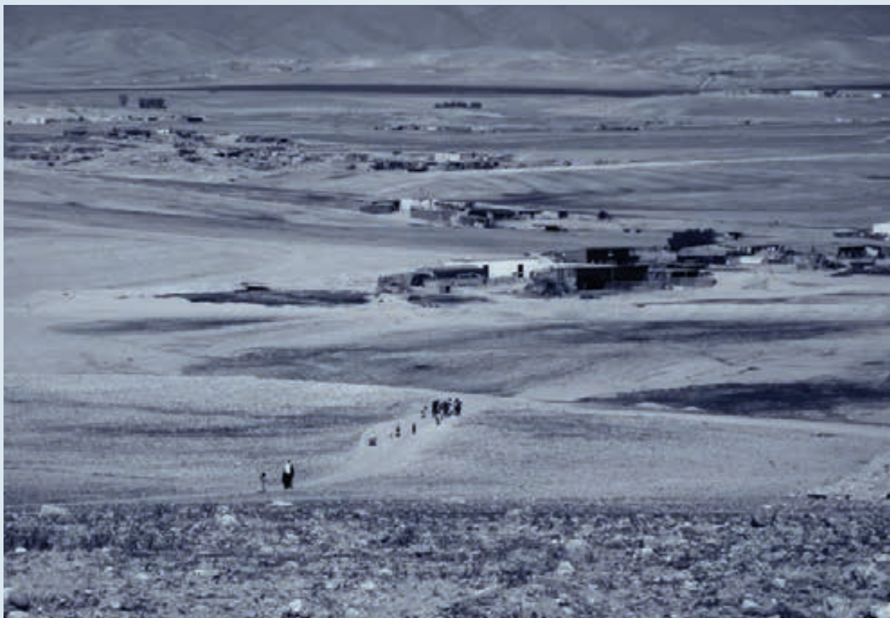
אמון הבדואים במדינה נמצא בשפל, והם חוששים שינושלו מאדמותיהם

לאור זאת ובהתחשב בעובדה שרמת האמון בין המדינה לבין האוכלוסייה הבדואית נמצאת בשחיקה מתמדת, דרוש תהליך רציני ומקיף של בניית אמון, שבו הקהילה הבדואית תהיה חלק מתהליך קבלת ההחלטות. תחילה, יש לעצור באופן מְיָד את הריסות הבתים המתרחשות כמעט על בסיס יומי, ועל המדינה להתחיל באופן מְיָד בשינוי המציאות של היישובים המוכרים הקיימים. תכנית כזו צריכה לטפל במכלול הבעיות הקיימות באותם