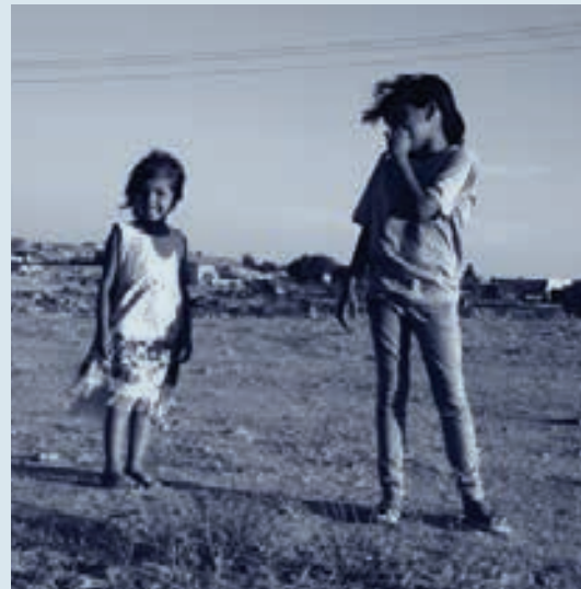
כ-60% מהאוכלוסייה הבדואית היא מתחת לגיל 20

המחלקה לגאוגרפיה ותכנון, אוניברסיטת בן-גוריון בנגב yiftach@bgu.ac.il