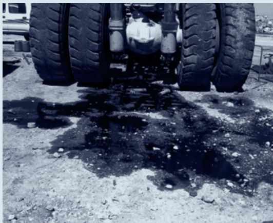
קרקע מזהמת בפסגת זאב, ירושלים

אין שום צורך בקרן לשיקום קרקעות מזהמות בישראל. זהו מנגנון לא הוגן, לא יעיל, וחסר הצדקה סביבתית. נראה שהרעיון יובא מארה"ב מבלי לבדוק אם הוא מתאים לנסיבותיה המיוחדות של ישראל. ואכן, הקרן שנתנה את שמה לחוק העוסק בשיקום אתרי פסולת מזהמת בארה"ב (ה-Superfund), שחנה סר זה מכבר - בשנת 1995 הופסקה הזרמת הכספים אליה ופעילותה הופסקה) נועדה לפתור בעיה שלא קיימת בישראל (ודאי שלא בהיקפים שנודעו לה בארה"ב): "הקרקעות היתומות" (orphan sites). אלה אותם אתרי פסולת מסוכנת שלא ידוע מי אחראי להם או שלא ניתן לאכוף בהם את הניקוי מסיבה כלשהי. מנגד, מספרן של הקרקעות היתומות בישראל הוא זניח ואינו מצדיק קרן, שהיא כלי בזבזני הצורך משאבים כדי לקיים את עצמו. הצעת החוק מנמקת את הצורך בקרן ב"זיהום שמקורו ב"פעילות התעשייתית רבת השנים בארץ", וכן ב"פעילות ביטחונית". אלא שבעוד שהתעשייה בארה"ב קיימת מזה כמאתיים שנה וחלקה נעלם זה מכבר, בישראל הוקמה עיקר התעשייה ב-50 השנים האחרונות. המפעלים הגדולים היו בבעלות המדינה או ההסתדרות, ורק מיעוטן של חברות התעשייה הגדולות נעלם. קל וחומר שה"פעילות הביטחונית" לא מצדיקה את הקרן. כידוע, חלק הארי של זיהום הקרקעות בישראל נגרם על-ידי התעשיות