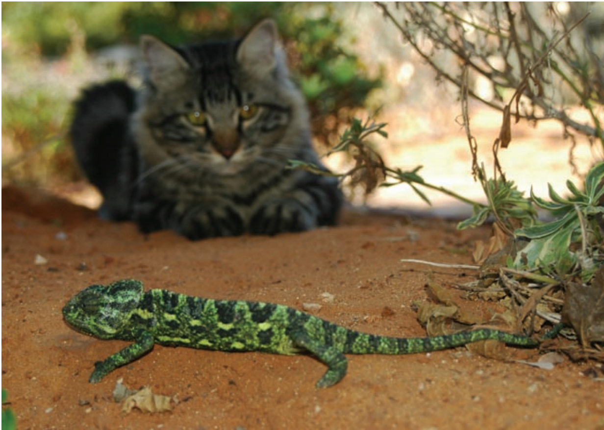
חתול אורב לזיקית מצויה

חוקרים בארץ ובעולם קוראים לסילוקם המיידני של חתולי-בית משמורות טבע ומשטחים פתוחים, להפחתה משמעותית של מספר החתולים בערים וביישובים, לחקיקה שתגביל האכלת חתולים ברחובות, ולחינוך בעלי חתולים להחזקה אחראית של חיית-המחמד שלהם. אך קולם של אלה הוא בודד וחלש