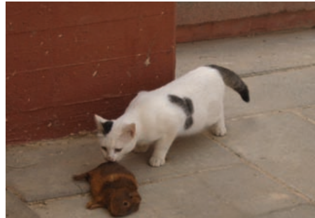
חתול האוחז בפיו מכרסם (שרקון), מדרשת בן גוריון