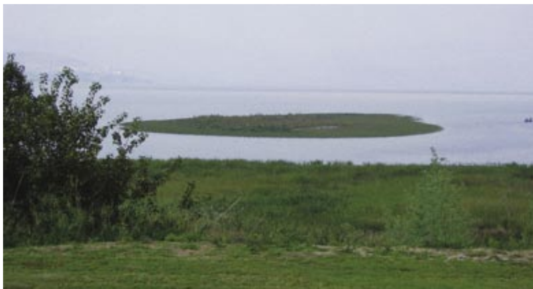
”אי בכנרת” - יבשה שנחשפה מול קיבוץ מעגן בשל ירידת מפלס הכינרת.

מילות מפתח: שינויי אקלים • משק המים • מומחים • מסגרות הבנה • בעלי עניין