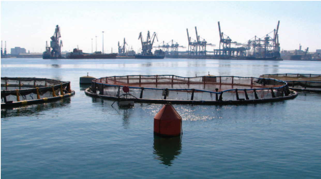
כלובי דגים בנמל אשדוד

המצע שונות, אולם ייתכן שהשוני נובע מתנודות רב-שנתיות, שבאו לידי ביטוי גם בתחנת הבקרה המרוחקת כ-11 ק"מ מחוות הדגים. למרות המלצה להמשך הניטור, לא נערכה דגימה נוספת, ואין מידע על מצב הסביבה והחי כיום. עם זאת, בניטור חוות כלובי הדגים שפעלו במפרץ אילת עד שנת 2008, נמצאו העשרה אורגנית של סביבת חוות, העברת גורמי מחלה בין דגי כלובים לדגי בר, הופעה (introduction) של מינים זרים ופגיעה פיזית בסביבה החופית. החברה לחינוך ימי בישראל, המפעילה את כפר הנוער הימי מבאותים, מקדמת את הסדרת הרישום הסטטוטורי של אתר הניסויים לבחינת טכנולוגיות לכלובי דגים. היקף הייצור השנתי באתר הוא עד כ-200 טונות.