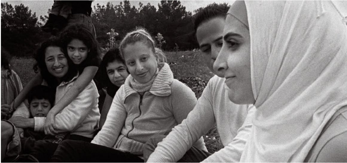
אירוע חניכת מטע זיתים אורגני של ארגון "סינדיקת הגליל" בוואדי ערה, שתוכנן לפעול על פי עקרונות הסחר ההוגן עוד לפני נשעתו |

בישראל וברשות הפלסטינית פועל הסחר ההוגן באמצעות ארגונים חברתיים וקואופרטיבים חקלאיים, הנסמכים בעיקר על סחר חוץ במוצריהם אך גם על מסחר ישראלי-פלסטיני בשמן הזית. נכון לשנת 2010 היו בגדה המערבית כ-2,500 מגדלים פלסטינים שייצרו שמן זית במערכת הסחר ההוגן, ואילו בגליל ובוואדי ערה היו רק מגדלים ערבים מעטים.