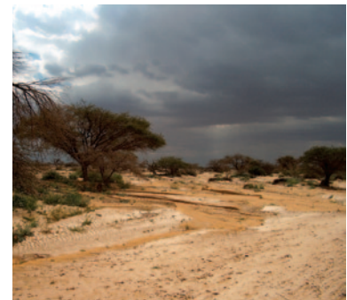
שמורת עין עופרים

מקורות המידע: מידע גאוגרפי - מרכז מידע גאוגרפי-אקולוגי (מג"א) ברשות הטבע והגנים - פורום מידע גאוגרפי תכנוני; טופוגרפיה - המרכז למיפוי ישראל; אורתופוטו - אופק 2010. מפה זו אינה אסמכתא לקביעת גבולות מדויקים. הקואורדינטות הן על פי רשת ישראל החדשה. הפקת המפה: בעז פריפלד, 5.9.2012.