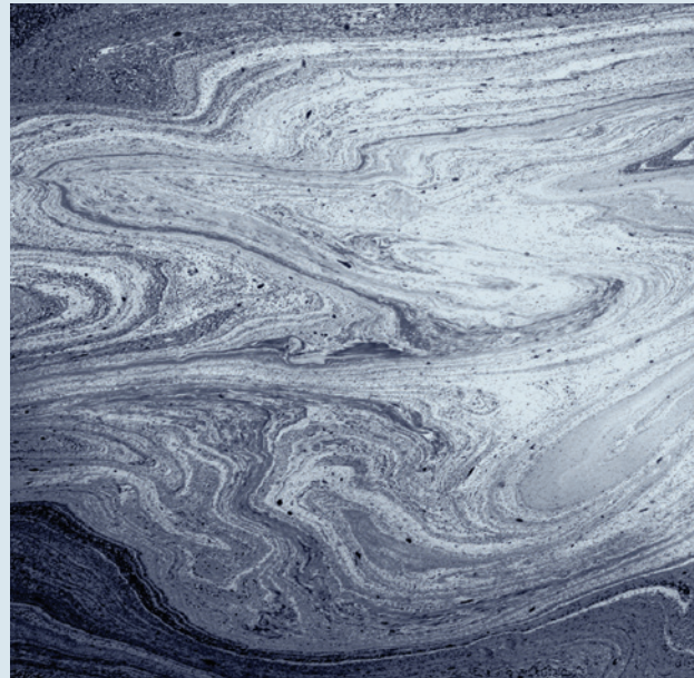
זיהום בתעלת מים

בעשור הקרוב יאלץ המשרד להגנת הסביבה להתמודד מול שורה של אתגרים רגולטוריים משמעותיים שיחייבו אותו לבצע קפיצה משמעותית ביכולת התכנון, הפיקוח והאכיפה שלו. בין האתגרים המשמעותיים ביותר ניתן למנות את יישומו של חוק אוויר נקי תשס"ח-2008, את הסדרי המחזור החדשים (חוק להסדרת הטיפול באריוזות תשע"א-2011, הצעת חוק למחזור פסולת אלקטרונית), שדרוג משמעותי של מערך הדיווח הסביבתי בישראל ועוד. המשרד מתמודד מול שורת האתגרים האלה מתוך נקודת מוצא