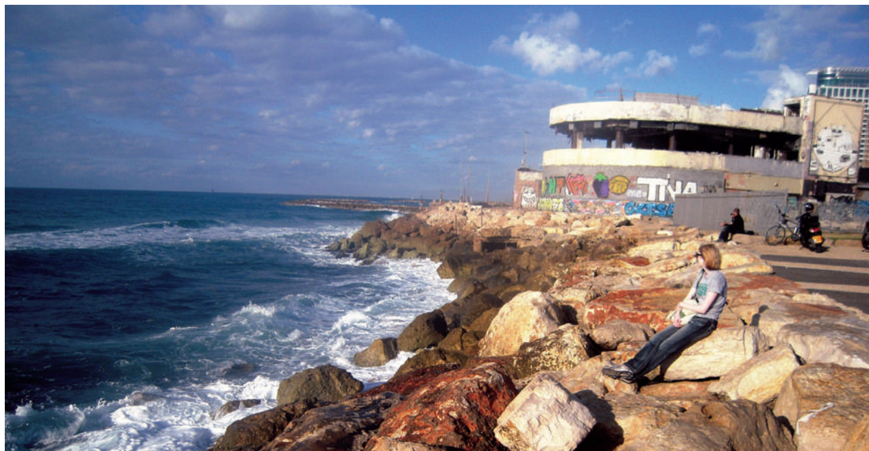
המצב הקיים - קיר המגן לאורך גן צירלס קלור. אופן הבנייה יצר קו חוף שאינו ידידותי לבני האדם הנופשים ולבעלי החיים בים

או שדות זיבורית לפי האקדמיה ללשון העברית). מושג זה מתאר אתרים או שטחים עירוניים שאינם מפותחים בעקבות בעיות שונות, כגון נגישות (לדוגמה: השטח בתוך מחלף תנועה), זיהום (אתרים ששימשו בעבר לתעשייה מזהמת), אי־הירות משפטית בנושא הבעלות ועוד. הנחת העבודה של הצוות היא שבחלק ניכר מאזורי החוף הפגועים אין אפשרות מעשית להשיב את האתר למצבו הטבעי, מפני שהאלמנטים ההנדסיים חיוניים ואינם ניתנים להעתקה למקום אחר. ההפרה של המאזן האקולוגי ומניעת הגישה ציבורית לים, המאפיינת אתרים אלה, היא תוצאה של הגישה התכנונית המודרנית המייעדת שטח באופן בלעדי לשימוש יחיד. זו גישה מתגוננת והגֵבֵית מטבעה (התגוננות מפני כוחות הטבע והבטחת היעילות התפעולית של מתקן התשתית), בזבזנית מבחינת ניצול קו החוף, ושוללת צרכים וערכים אחרים [3]. הגישה הרב־שימושית לתשתיות נועדה ליצור אגבור (סינרגיה) ושיתופיות בין בעלי עניין ושימושים שונים, כגון חקלאות ימית, תחבורה, אנרגיה וביטחון, ארגונים לאיכות הסביבה והשלטון המקומי. הייחוד של הגישה המוצעת במחקר זה הוא שנוסף לפיתוח גישה אקולוגית, שמשמרת בתי גידול חופיים ואף יוצרת אותם באופן פעיל [1], אנו מציעים לשלב גם שימושים לרווחת הציבור, כגון: ברכות חינוכיות וחוויות לילדים; אזורים המדגישים באופן חווייתי את כוחם של הגלים, הגאות והשפל; מדרגות ישיבה למבוגרים. גישה זו מותאמת במיוחד לתנאים של