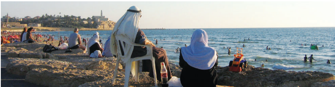
רצועת חוף ללא גישה נוחה לים. בסוף שנות ה-60 נערמו על החוף ובים הרדוד הריסות המבנים של שכונת מנשיה הסמוכה. על גבי ההריסות אלו נבנה גן צידלס קלוד, רובו ללא נגישות לים