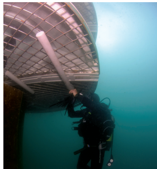
פתח צינור שאיבת מי הים במתקן ההתפלה בחדרה