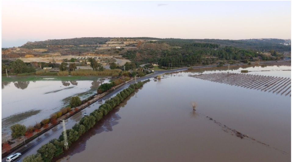
הצפנת בגבעת עדה, ינואר 2020

התוכנית הלאומית מתבססת על התובנות שעלו מתוכניות ההיערכות של הרשויות המקומיות ושל משרדי הממשלה בהתאם לשלב בהכנת התוכנית בכל אחד מהגופים השונים, וכן על התובנות שהוצגו בהחלטת הממשלה על "היערכות ישראל להסתגלות לשינויי אקלים" (מ-2018) [5]. מבנה התוכנית מבוסס על התוכנית הלאומית של ניו זילנד [6], שפורסמה לאחרונה ומשלבת אלמנטים מוצלחים מתוכניות מובילות של הולנד ובריטניה. התוכנית הלאומית של ישראל נפתחת בחזון של "חוסן והסתגלות לאומיים למגמות ההדרגתיות והקיצוניות של שינוי האקלים, לטובת שגשוג וצמצום הפגיעה בחברה, בכלכלה ובסביבה", ומחולקת לשישה עולמות תוכן (ביטחון וחירום, כלכלה, שטחים בנויים ותשתיות, חקלאות ומים, בריאות ורווחה) הנפרטים ל-16 יעדים, ל-48 מהלכים ול-198 משימות. במסגרת התוכנית הלאומית אופיינו המהלכים השונים וחולקו לקטגוריות שונות, וכן נקבעו גורמים מובילים ושותפים לצד מסגרות תקציביות מוערכות ולוחות זמנים לביצוע. במסגרת תהליך הכנת התוכנית קבעה המנהלת סדר עדיפויות ראשוני של מהלכים מכלל עולמות התוכן. התוכנית כוללת גם חמישה עקרונות פעולה מרכזיים, שעומדים בבסיס אסטרטגיית ההיערכות: התייחסות לאוכלוסיות פגיעות, שימוש בפתרונות מבוססי-טבע, שימוש בפתרונות מודולריים וגמישים, יצירה של שיתופי פעולה רב-מגזריים ובין-לאומיים ושותפות מרכזית עם שלטון מרכזי.