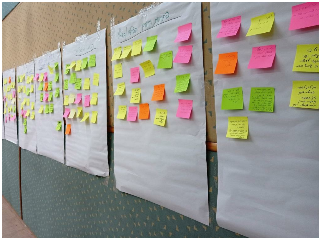
פתקיות המציגות תוצרי עבודה בקבוצות בשלב גיבוש ההמלצות באספת האזרחים הראשונה שהתקיימה בישראל – קריית טבעון, 2022

סוגיות המתאימות להיות מטופלות באמצעות אספת אזרחים הן בין-תחומיות, מערבות בעלי עניין רבים, מעוררות מחלוקת ומורכבות לפיזוח (wicked problems). על כן, אין זה מפתיע שמדינות רבות מנהיגות אספות אזרחים כחלק מההתמודדות עם משבר האקלים. הבולטת בין יותר מ-100 אספות האקלים שכבר בוצעו, היא זו שכניס נשיא צרפת מקרון ב-2019 במטרה לבחון כיצד צרפת יכולה לצמצם את פליטות גזי החממה ברוח הצדק החברתי, והיא דנה בנושאים: דיור, תחבורה, אוכל, צריכה, עבודה וייצור. גם אספת האקלים באוסטרליה עסקה בנושאים דומים במסגרת השאלה: "כיצד אוסטריה יכולה להגיע לניטרליות