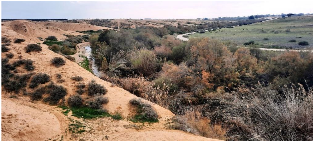
נחל הבשור. "המחקר הבין-לאומי על בניית חוסן אחרי אסון מצביע על כך ששילוב התושבים במציאת פתרונות יישומיים הוא מהמרכיבים החשובים ביותר להצאת התאוששות, לבניית חוסן של קהילות ולשיקום האמוץ"

גופר ר, דוניץ ד, זגמן ד ואחרים. 2024. אספת אזרחים בנגב המערבי – למה היא חיונית ולמה עכשיו? אקולוגיה וסביבה 15(1).