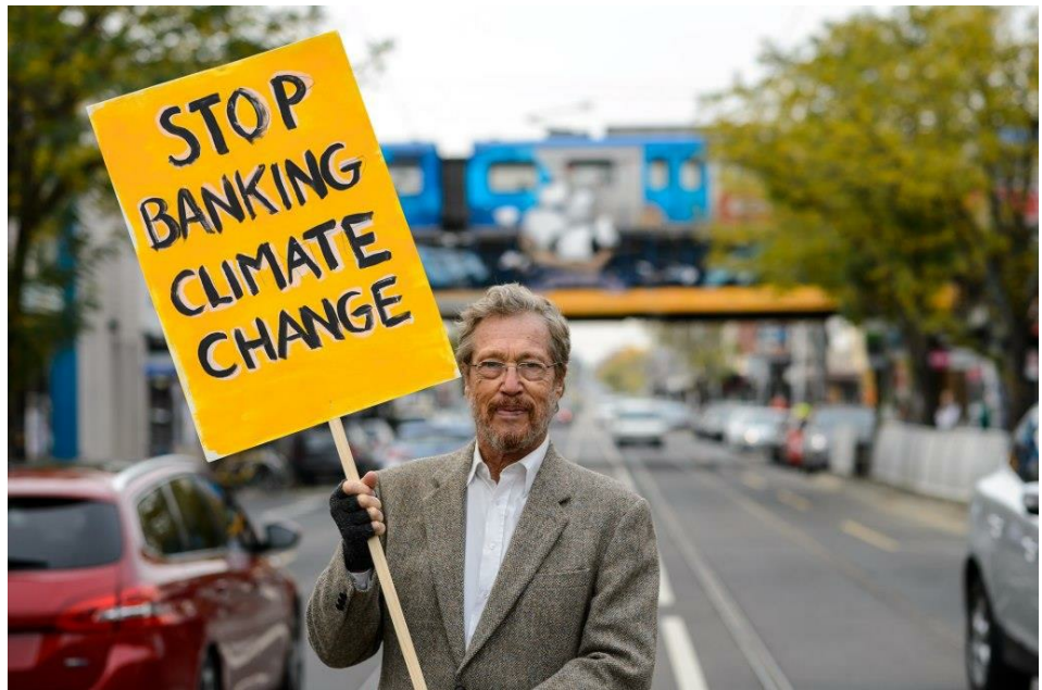
הפגנה כנגד בנק Commonwealth במלבורן (אוסטרליה), מאי 2017. גם בישראל מושמעות ביקורת על מדיניות ההשקעות של הבנקים וקריאה להפסקת מימון גופים התורמים משמעותית לפליטות גזי חממה

יש למערכת הבנקאית תפקיד חשוב מאוד כמתווך פיננסי, אבל הוא משני בהשוואה לשאלות של מדיניות, ראייה הוליסטית, ראייה לטווח ארוך והקצאת משאבים. הדבר המרכזי ביותר הוא המדיניות הממשלתית, וממנה צריכים להיגזרו יעדים ברורים ואכיפה. המערכת הבנקאית צריכה לסייע להגיע לאותם יעדים, בין היתר על-ידי ליווי לקוחות עסקיים בגיבוש תוכנית מעבר שתיתן מענה להקטנת הפליטות. נוסף על כך, הפיקוח על הבנקים ישקול את הרחבת המסגרות המותרות לבנקים, אם תידרש, לחשיפה לפרויקטים תשתיתיים "רוקים", כגון אנרגיה ממקורות מתחדשים. הסיוע לעמידה ביעדים צריך להיעשות, כמובן, תוך שמירה על יציבות המערכת הבנקאית ועל טובת האזרחים.