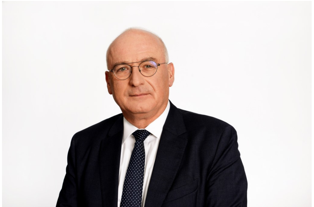
מר יאיר אבידן, המפקח על הבנקים

אילון א ובוקמן ש. 2022. הסתכלות פיננסית על סיכוני האקלים – ריאיון עם מר יאיר אבידן, המפקח על הבנקים. אקולוגיה וסביבה 13(3): 102–104.