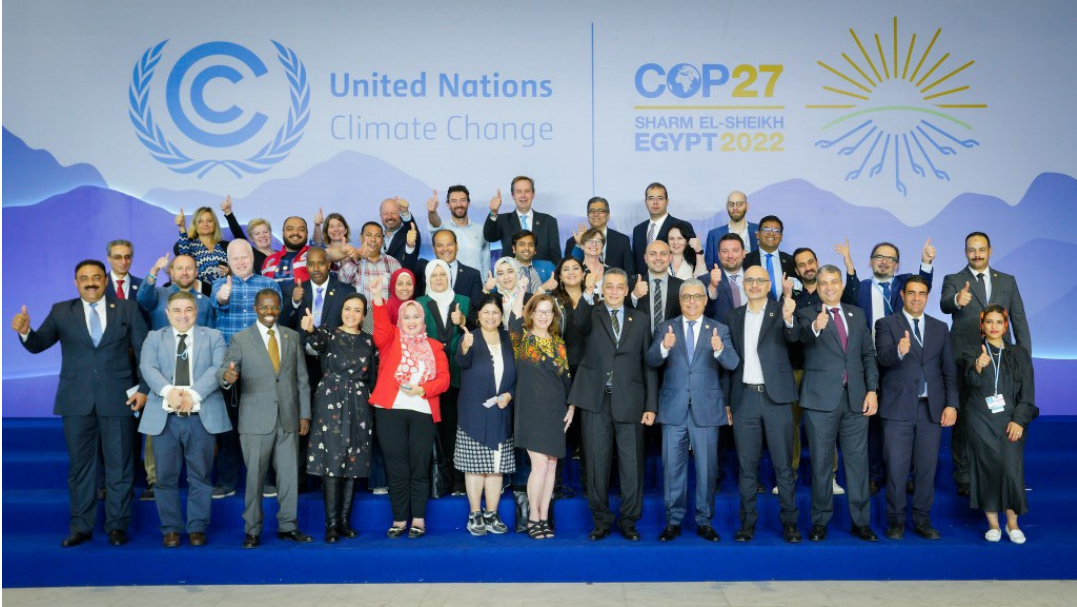
ועדת ההיגוי של ועידת האקלים בשארם א-שייח'

אילון א ובוקמן ש. 2022. לעשות מהלימון לימונדה. אקולוגיה וסביבה 13(3):3.