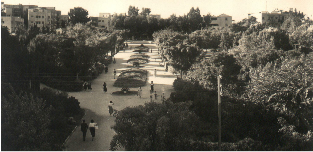
גן מאיר, שנות ה-40 של המאה הקודמת

גורני ע. 2022. גן מאיר / נתן אלתרמן. אקולוגיה וסביבה 13(3): 99-98.