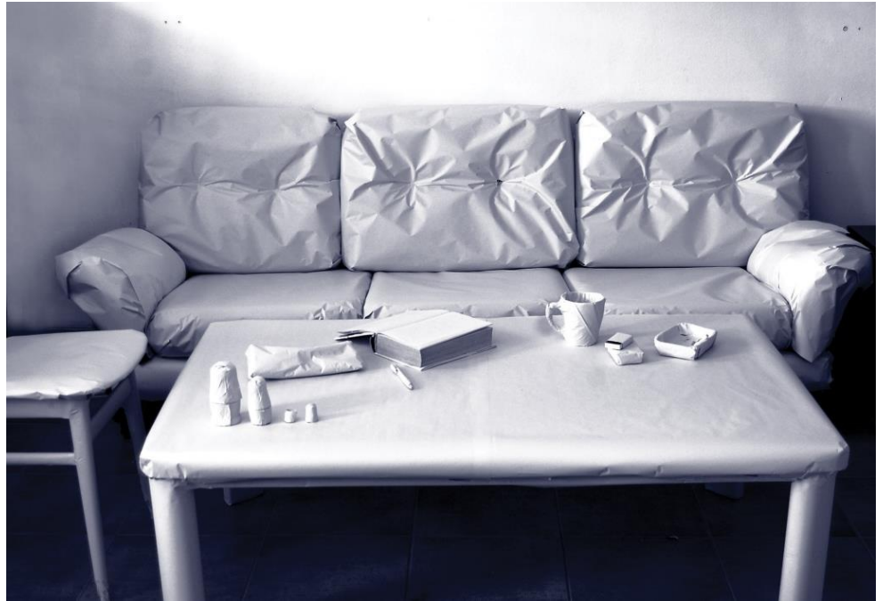
ספה 050, חברת הראווה | אייריס שפיצר, המכללה האקדמית עמק יזרעאל, בית ספר גורן לתקשורת חזותית

המשרד להגנת הסביבה צריך לשקול צעדים מעשיים שיעודדו חברות ישראליות לאמץ את התקנים שנזכרו לעיל ולהביא בכך להרחבת המארג הרגולטורי שבאמצעותו ממש המשרד את יעדיו. אמנם קיימים תמריצים נוספים לאימוץ של תקנים פרטיים, כגון תמריצים כלכליים ותמריצים אידאולוגיים, אולם בתמריצים אלה אין די. במסגרת מאמר קצר זה אוכל רק להזכיר באופן כללי את הצעדים שהמשרד יכול לנקוט [2]. ראשית, המשרד יכול להפעיל תמריצים מנהליים שונים. המשרד יכול למשל לחייב חברות בעלות סיכון גבוה לסביבה לאמץ את מערכת הניהול הסביבתית ISO 14001 (כתנאי לקבלת רישיון עסק או היתר רעלים). חברות בעלות הסמכה ל-ISO 14001 ושמדווחות לפי כללי ה-GRI יכולות לקבל הקלות בהליכי רישוי ובתדירות הפיקוח, והפחתה בדרישות הדיווח (בהסתמך על דיווח ב-GRI). תמריצים נוספים בעלי אופי כלכלי יכולים להיות מתן עדיפות במכרזים ממשלתיים לחברות שאימצו תקן סביבתי פרטי (או שילוב של תקנים) ואימוץ מערכות אלה על-ידי רשויות המדינה (ובכלל זאת רשויות סטטוטוריות וחברות ממשלתיות). המשרד להגנת הסביבה בשיתוף משרד ראש הממשלה החל לפעול בכיוון שתואר כאן, למשל בניסיון לגרום לכך שבפעילות הרכש הממשלתית יבואו לידי ביטוי שיקולים סביבתיים, אולם נראה שההשפעה של צעדים אלה עד היום הייתה מועטה, ולא היה בהם כדי ליצור תמריצים שיוכלו להביא לאימוץ של קודים בין-לאומיים כפי שהוצע לעיל. נוסף על תמריצים מנהליים יכול המשרד לאמץ תמריצים הנוגעים למדיניות הענישה.