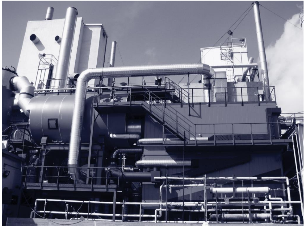
מפעל לייצור קפה נמס של עלית, מקבוצת שטראוס

התמודדות מיטבית מול האתגרים הסביבתיים שיעמדו בפני ישראל בעשור הבא מחייבת לדעתי מאמץ לשילוב מנגנונים פרטיים, שיש להם סינרגיה עם יעדי המדיניות של המשרד להגנת הסביבה, לתוך המארג הרגולטורי הקיים. כיום קיימים בשוק הישראלי – כחלק מהשתלבותו במשק העולמי – שורה של מנגנונים פרטיים שגלומה בהם סינרגיה כזו. בין המכשירים האלה ניתן למנות את מערכת הניהול הסביבתית ISO 14001, את כללי הדיווח של אחריות תאגידית של ה-Global Reporting Initiative, את מערכת התו הירוק הישראלי (שהושקה מחדש בשנת 2010 במסגרת מנהלת משותפת חדשה בראשות המשרד ומכון התקנים) ואת מדד מעלה (שמאפשר לחברות המובילות במשק לבחון ולדרג את ביצועיהן בתחום האחריות התאגידית). מחקרים רבים שפורסמו בעולם בחמש השנים האחרונות מעידים כי המנגנונים הפרטיים שנזכרו לעיל יכולים להביא לשיפור של ממש בהתנהגות הסביבתית של חברות המאמצות אותם, והם אינם רק סוג של העמדת פנים 'ירוקה' (greenwash) או 'דיבור-ריק' 3 . 5,4 יתר על כן, במקובץ יוצרים מנגנונים אלה רשת רגולטורית שבין רכיביה השונים קיימים סינרגיה והזיון חוזר חיובי בכל הנוגע לפיקוח ולאכיפה. עמדה ספקנית כלפי אסדרה (רגולציה) פרטית שמבקשת להסתמך באופן בלעדי על חקיקה ועל אכיפה ממשלתית, מתעלמת הן מהפוטנציאל הרגולטורי שגלום במכשירים הפרטיים שצוינו לעיל הן מהמציאות הפוליטית של מחסור מתמשך במשאבים, שבגדרה פועל המשרד להגנת הסביבה.