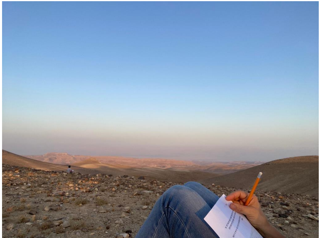
סדנת כתיבה בטבע. ערד, 2021