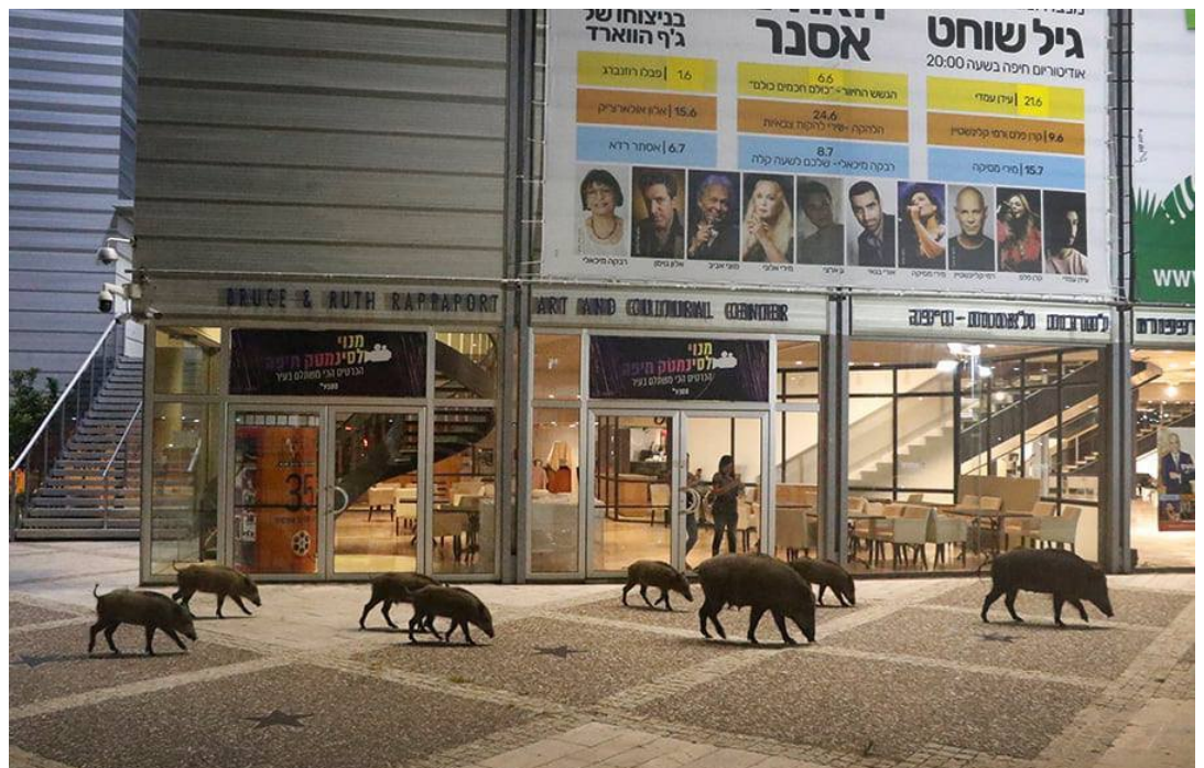
חזירי בר ברחבת מרכז רפפורט לתרבות ואמנות, במרכז הכרמל בחיפה, יוני 2021. "אין להם מקום כבר בארץ הבטון", כתבה אני משועל בשיר "עקבות חזירי הבר"