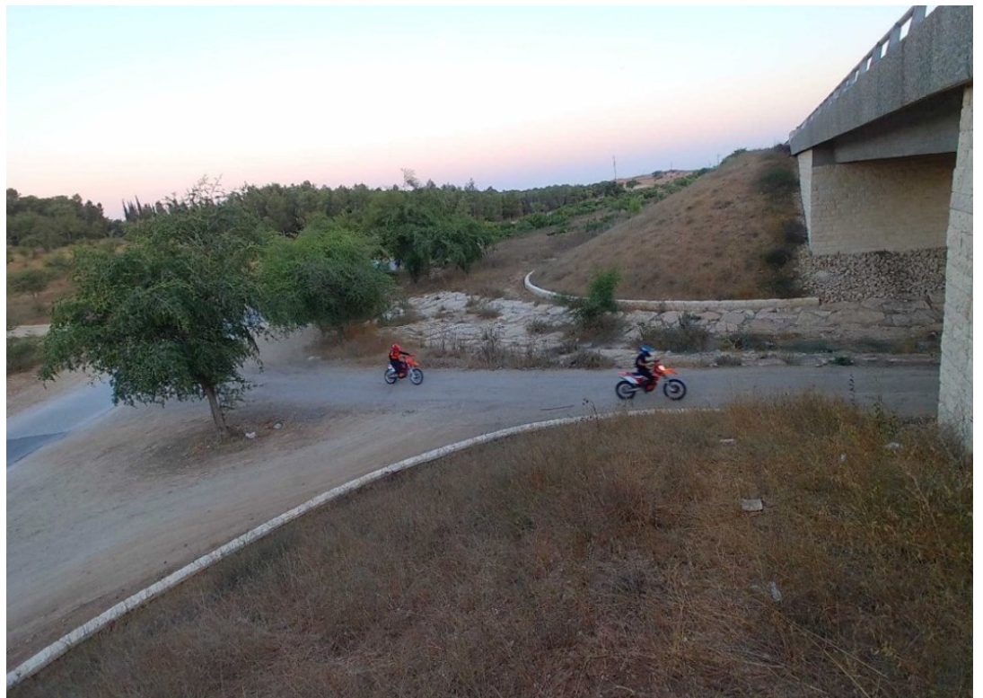
רכבי אופנועים בכניסה ליער מכיוון העיירה לקייה, יולי 2020