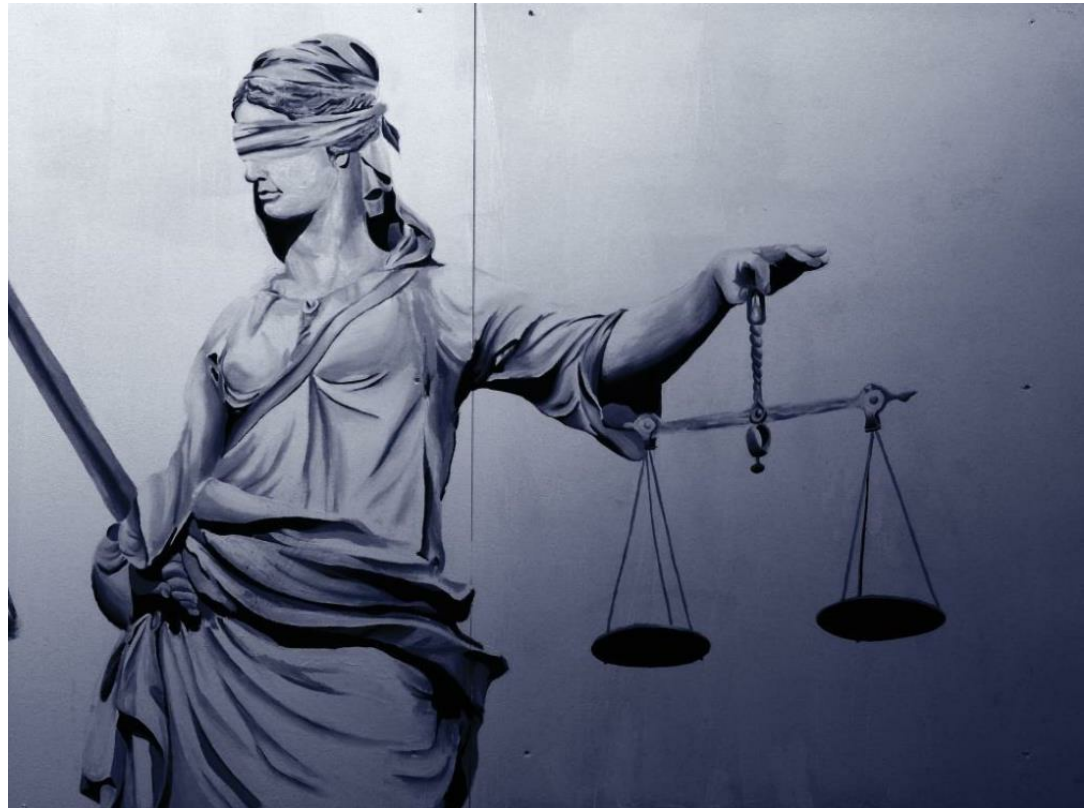
עקרון ההיזהרות, מאבני היסוד של דיני סביבה, מנחה כיצד לפעול במצבים שיש בהם יש אי-ודאות מדעית הנורמת לחוסר יכולת לנבא באופן מהימן את ההשלכות של הבחירות המדיניות שלנו על הסביבה ועל בריאות האדם

קרסין א. 2017. רב-שיח בנושא יישום עקרון ההיזהרות בישראל – קבלת החלטות קשות בעידן של חוסר ודאות. אקולוגיה וסביבה 8(2).