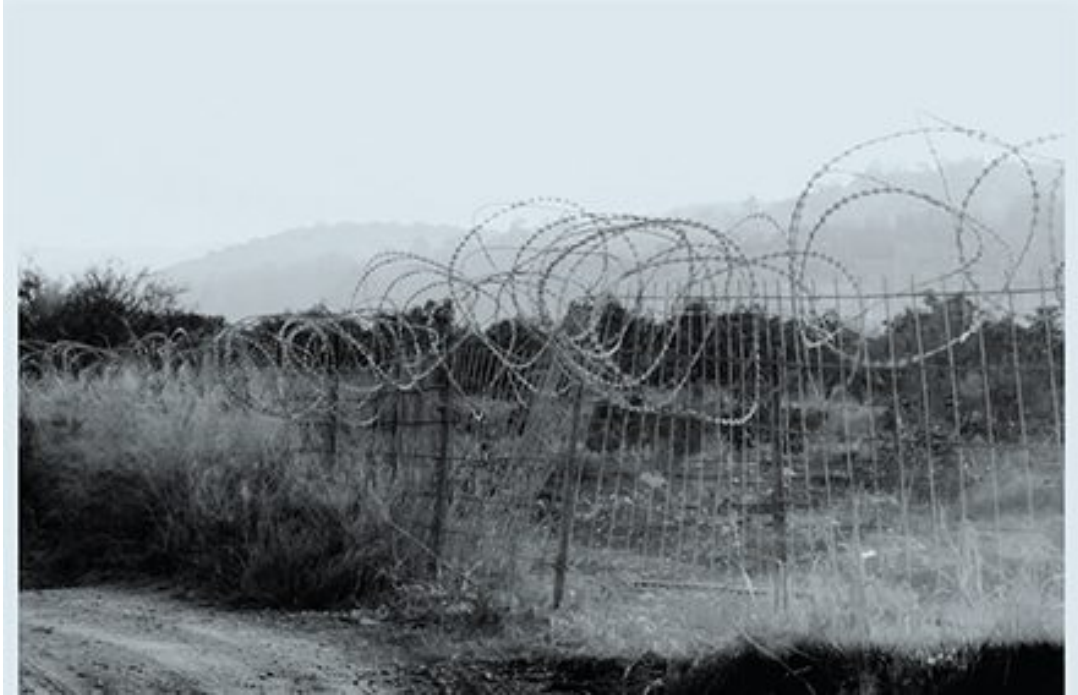
גדר הפוגעת בקישוריות של המסדרון האקולוגי באזור נחל עירון

תוכן זה הוא חלק מרב-שיח. לחצו כאן לדין המלא