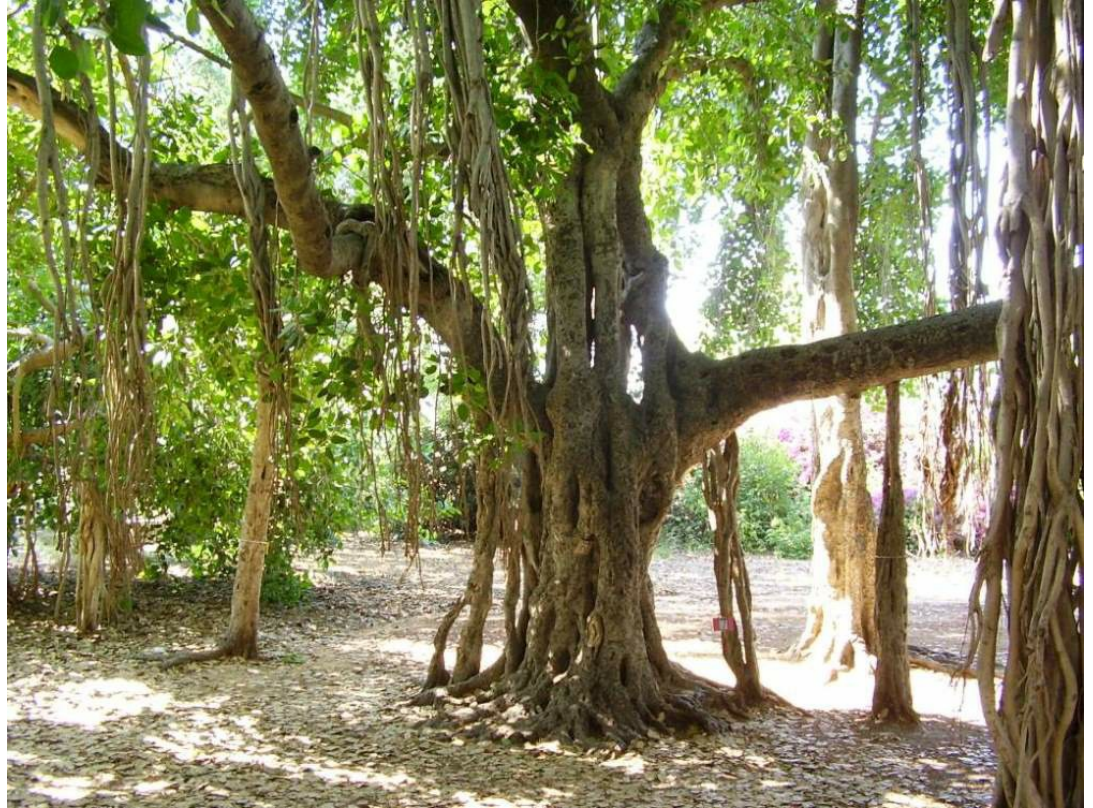
הפיקוס הבנגלי במקווה ישראל – העץ בעל הצמרת הגדולה ביותר בארץ

גלון י. 2021. עצי מורשת בישראל – מסקנות מ-30 שנות מעקב אחר עצים בוגרים בישראל. אקולוגיה וסביבה 12(1).