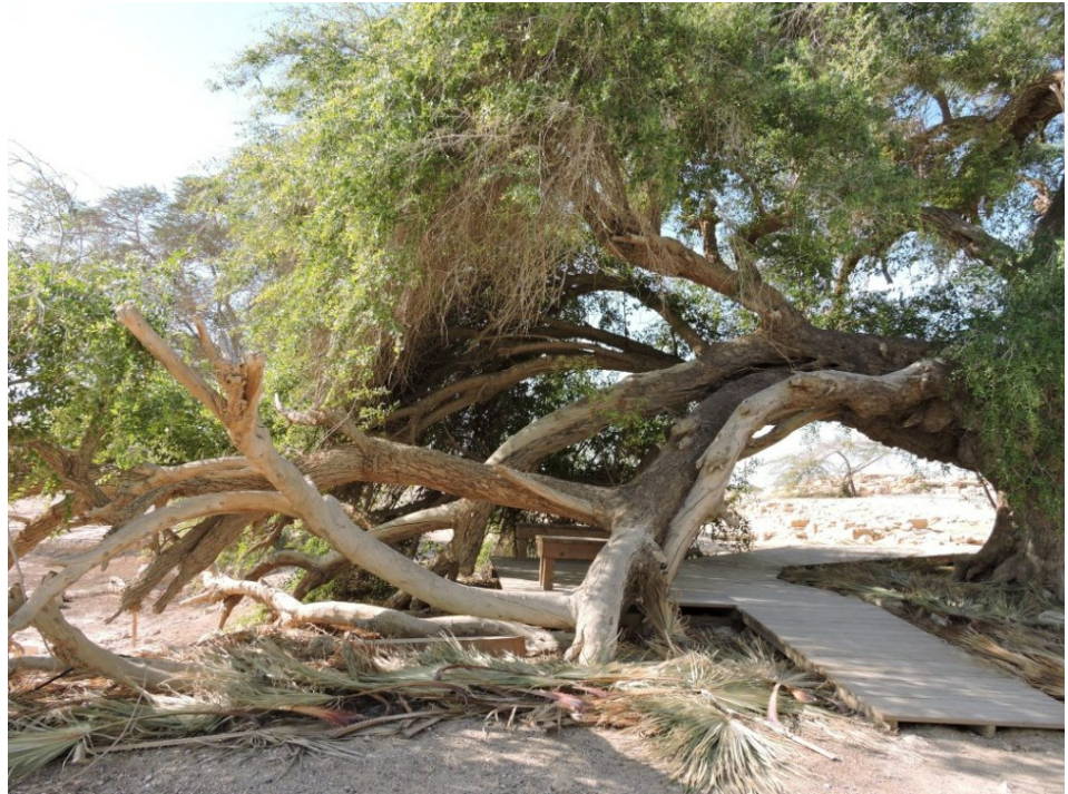
שיזף מצוי בעין חצבה, שגילו 600–2,000 שנים – המועמד המוביל לתואר העץ העתיק ביותר בישראל

ידיעה זו מתארת ממצאים מרכזיים בעבודה שבוצעה בשנים 1990 עד 2019, שתועדה ופורסמה בדו"ח מחקר [2], במאמרים בעיתונות המקצועית [1] ובחוברות 'טיולים בעקבות עצים' [3,4].