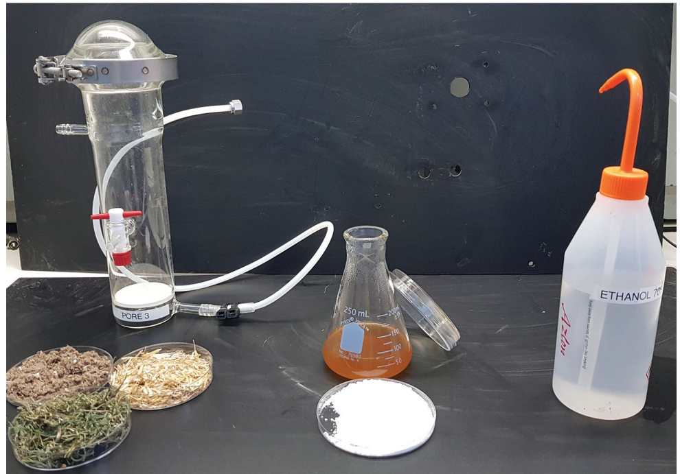
אילוסטרציה של תהליך ייצור אתנול מפסולת צמחית. משמאל: דוגמאות של סוגי פסולת שונים (קש, פסולת נייר וגום) ביחד עם הריאקטור המעבדתי; במרכז: הסוכרים המופקים מהתהליך, יחד עם השמרים; מימין: האתנול המופק מהתהליך

הלפרן ב, פרץ ר, גרשמן י וממן ה. 2020. זבל של אדם אחד הוא אוצר של אדם אחר – שימוש בפסולת צמחית לייצור חומר חיטוי למאבק במגפת הקורונה. אקולוגיה וסביבה 11(4): 61-63.