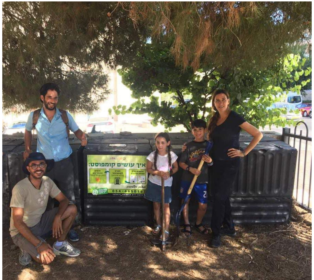
משפחה המשתתפת במיזם 'מהפח ירוק' (מימין) יחד עם אנשי צוות של המיזם, ליד עמדת קומפוסט בשכונת גוננים בירושלים

פליטמן י. 2020. קומפוסטציה ביתית בבנייני דירות – ניתוח הגורמים להשתתפות במיזם 'מהפח ירוק' בירושלים. אקולוגיה וסביבה 11(4): 57-59.