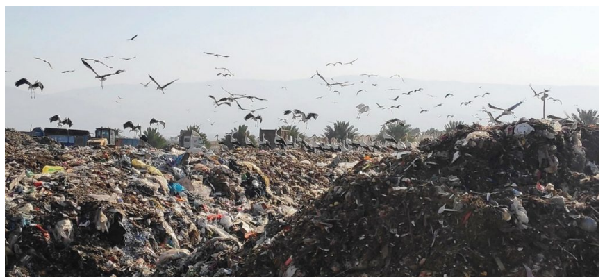
אתר לטיפול בפסולת אורגנית בבקעת הירדן

אחוז המחזור הגבוה ביותר בתעשייה (איור 1) נרשם בקרטון (83%). חומרים נוספים שנרשם בהם אחוז מחזור גבוה הם מתכות (77%), זכוכית (71%) וחומר אורגני (62%). לעומתם, אחוז מחזור נמוך יחסית נרשם בפלסטיק (27%).