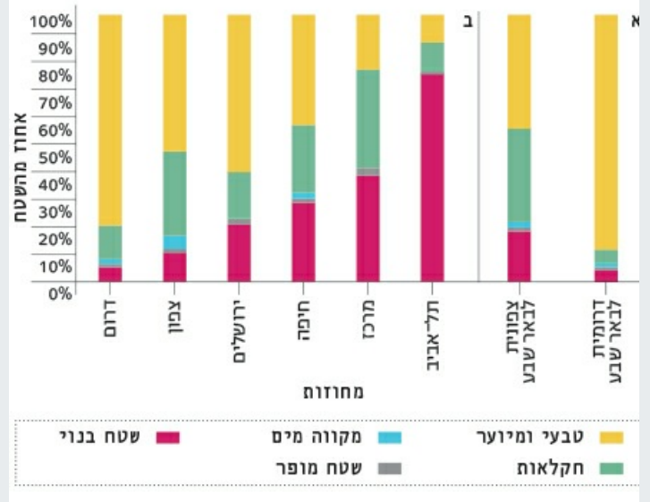
איור 2. חלוקת שטחים לפי חמש קטגוריות עיקריות של תכנית ררומית וצפונית לקו באר שבע (א) ועל פי חלוקה למחוזות של משרד הַפְּנִים (ב).